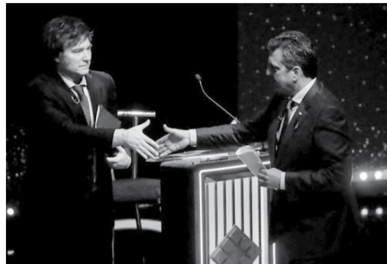
Cara a cara. Desde las 21, el ministro y el economista confrontarán por última vez.

En este sondeo, el candidato de LLA arroja un 45,9% de imagen positiva frente a un 44,4% de su oponente de UxP. Aunque es llamativo que en los dos casos, la imagen negativa que arrojaron los dos es más alta que la positiva: 48,8% para