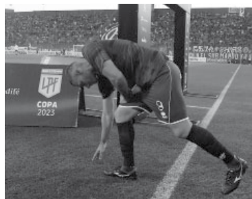
Un goleador inoxidable. - Lanús -

La gente de Lanús concurrió ayer al estadio para presenciar un partido importante frente a Racing, un rival directo por la clasificación a la Copa Sudamericana 2024, pero sobre todo para decirle adiós a su máximo go-