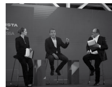
Representantes de las 23 provincias participaron del encuentro.

En la entrevista estuvieron presentes periodistas del Canal 9 Litoral; La Nueva de Bahía Blanca; MDZ, de Mendoza; El Territorio, de Misiones; La Mañana, de Neuquén; El Tribuno, de Salta; El Liberal, de Santiago del Estero; Canal 7, de Ju-