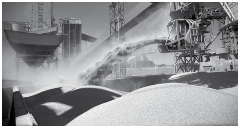
Clave. Las ventas externas del complejo sojero son fundamentales para el arranque del próximo gobierno.

“Octubre se ha convertido en un mes de definiciones para los cultivos argentinos. Las ansiadas lluvias