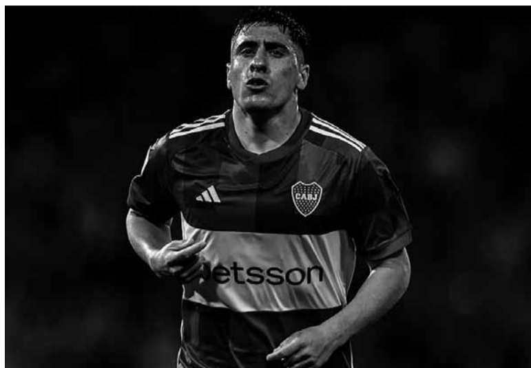
Intocable. El goleador "charrúa", recientemente adquirido por Boca.

Árbitro: Andrés Gariano. Cancha: José Dellagiiovanna. Hora: 16.45 [TNT Sports].