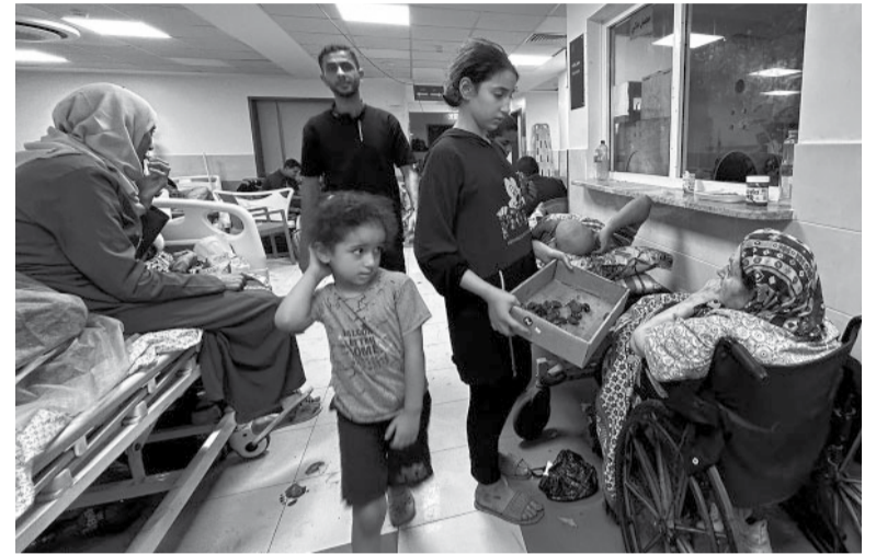
Angustiante. El complejo médico está totalmente sitiado por el asedio y el bloqueo israelí.