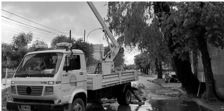
Peligroso. En Mar del Plata, una gran cantidad de cables eléctricos quedaron sobre la calzada.

Así, en el Conurbano bonaerense se registraron caída de árboles y postes en los partidos de Berazategui, Lanús, Quilmes y Morón. En este último caso, un árbol se derrumbó sobre dos vehículos pero no hubo