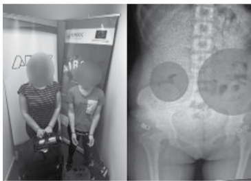
Las mujeres, por el escáner que detectó la maniobra.

La Trochita, denominada así por su trocha angosta de 75 centímetros, fue inaugurado en 1945.