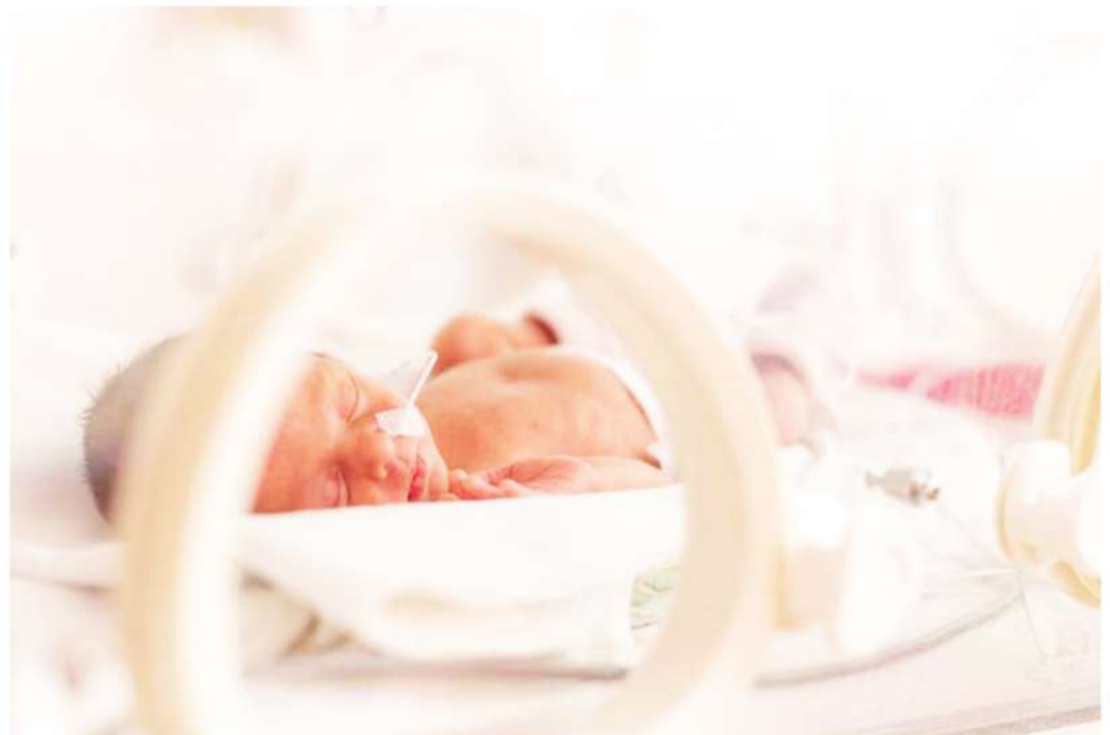
Bebés prematuros. Se estima que cerca de 1 de cada 10 nacimientos se da antes de término.

→ Cerca de 1 de cada 10 nacimientos se da antes de término P.3