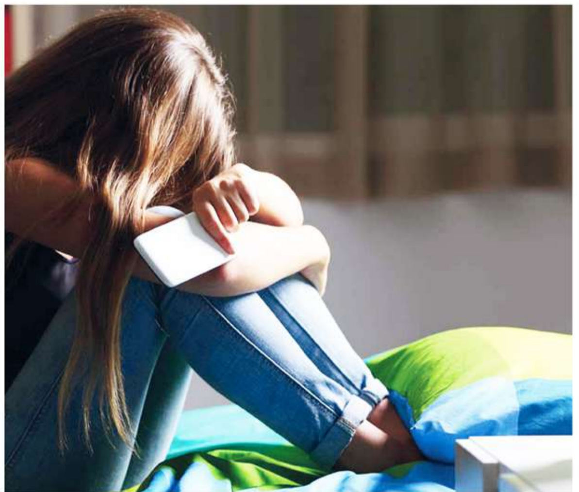
TikTok. Alertan que contenidos de salud mental en TikTok representan "un peligro" para niños.

Según los resultados de la investigación difundida, los videos relacionados con salud mental son "potencialmente dañinos" y "suponen un peligro", en especial para el rango etario de los más jóvenes.