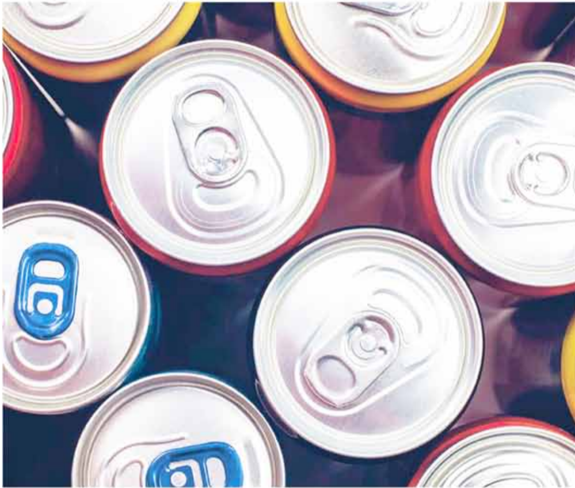
Bebidas energizantes. En Argentina se toman unos 125 millones de latas al año.

En Argentina se toman unos 125 millones de latas al año y su consumo excesivo puede provocar problemas de salud.