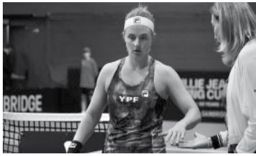
La "Peque" Podoroska. - AAT -