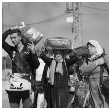
Gazatíes continúan huyendo hacia el norte. - Télam -

“Este es el momento del que habíamos estado alertando al mundo”, dijo el viceministro de Salud de la Franja, Yusef Abu Al-reesh, al referirse al panorama en el hospital Al Shifa en declaraciones a la cadena Al Jazeera.