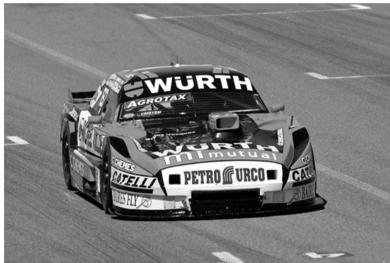
Llegó. Tras 195 carreras, el de Dodge fue la referencia del sábado.

"Muy contento por cómo estamos terminando el año. Salí