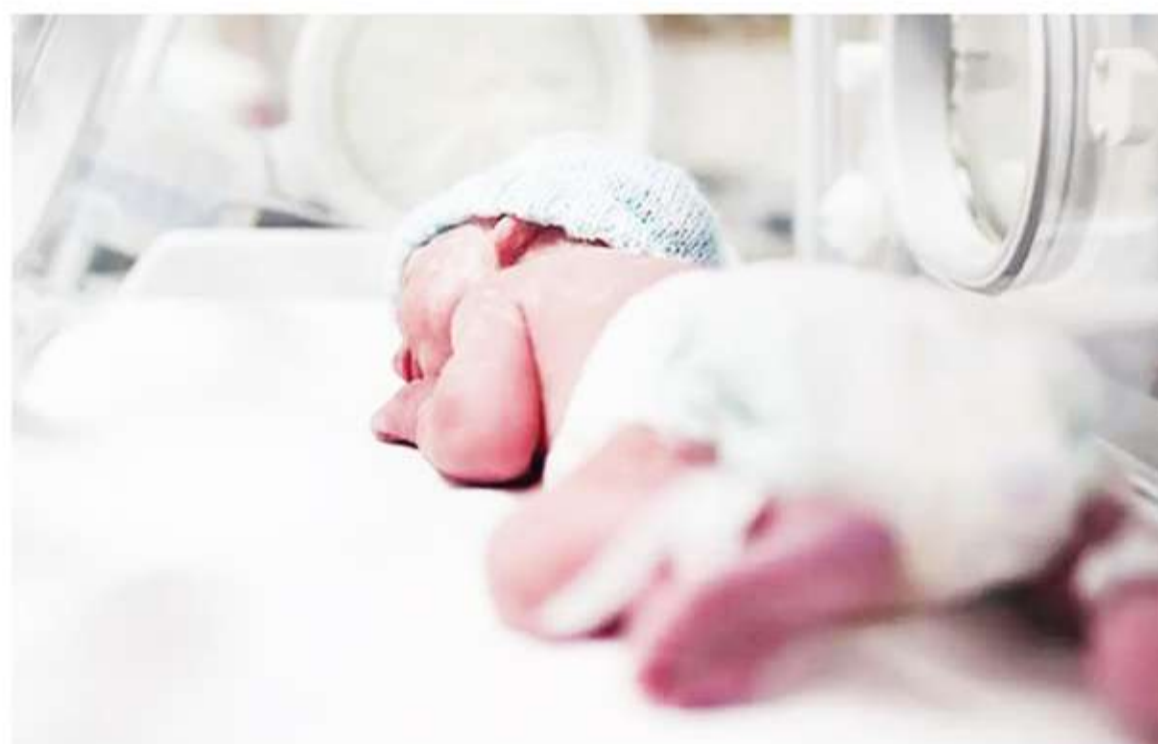
Nacimientos. Para prevenir el parto prematuro se vuelven fundamentales los controles prenatales.

Por lo tanto, para prevenir el parto prematuro, se vuelven fundamentales los controles prenatales, durante los cuales se pueden ir tomando las medidas necesarias. Específicamente, la OMS recomienda un mínimo de