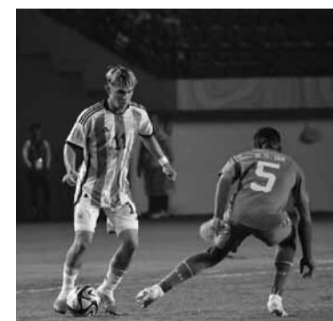
Ahora, el martes contra Japón.