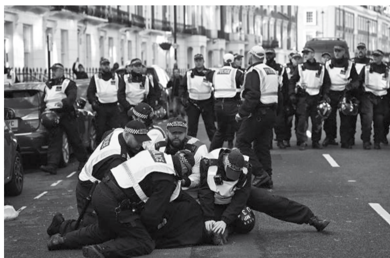
Enfrentamientos entre derechistas y la policía.

Además de la Franja de Gaza, la guerra se extendió a Cisjordania, territorio palestino ocupado por Israel desde 1967, Siria y Líbano, donde opera el movimiento chiita Hezbollah.