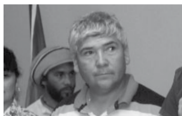
El titular de Atcade.

Los transportistas, según relataron ante la justicia quienes sufrieron las amenazas, durante todo momento intentaron que los trabajadores abandonaran el campo. Esta situación, se produjo meses después.