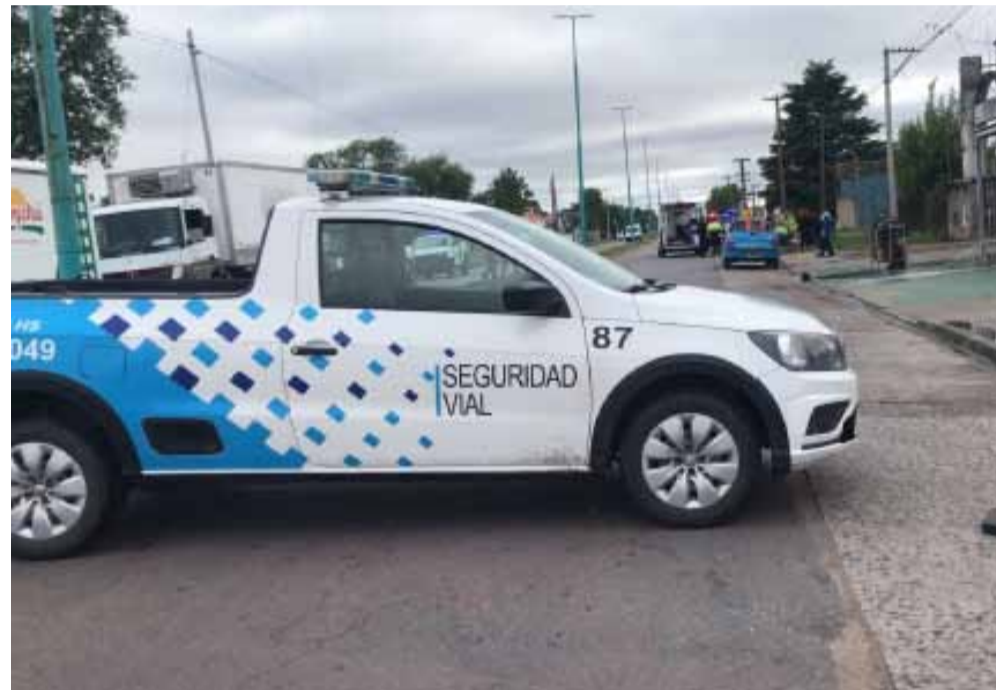
Detrás del móvil de Seguridad Vial se observa el camión contra el que impactó la motociclista.

gicas correspondientes. También trabajaron agentes de Seguridad Vial y de Defensa Civil municipal.