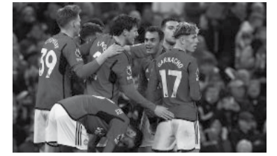
1-0 sobre Luton Town. - Manchester United -