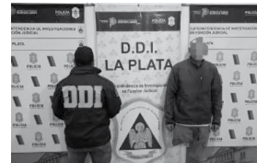
El adulto está acusado por presunto abuso sexual. - PBA -