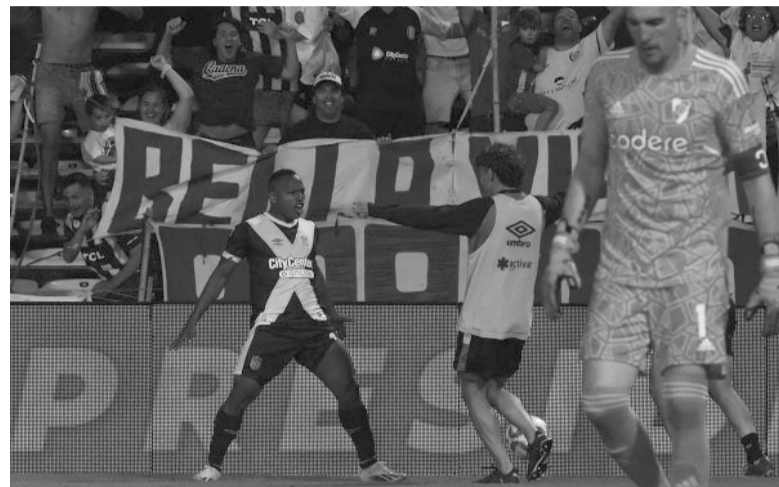
Figura. Campaz, el más desequilibrante del juego.

El partido pareció quedar servido para River, que continuó con