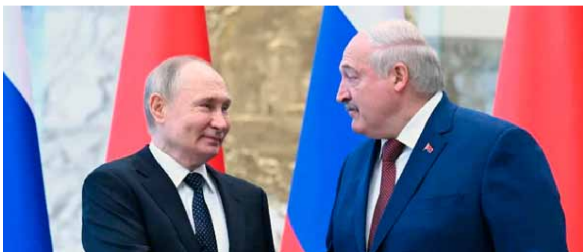
Alexander Lukashenko, junto a Putin

El presidente de Bielorrusia, Alexander Lukashenko, confirmó la presencia de armas nucleares en Bielorrusia y aseguró que varias decenas de ojivas nucleares ya fueron llevadas a su país.