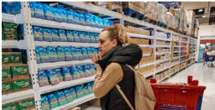
Es el índice de precios con menos incremento en cuatro años

En Noreste, la incidencia más alta se registró en prendas de vestir y calzado (1,9%) y en la región Noroeste, en restaurantes y hoteles (3,6%).