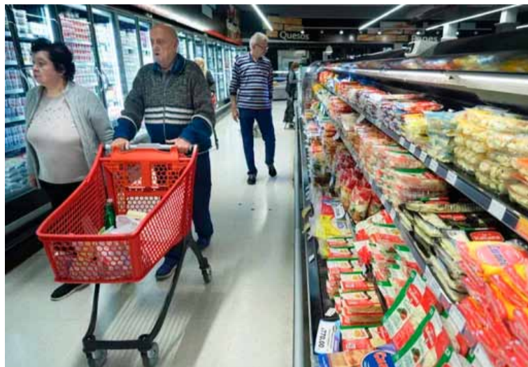
El Gobierno y el Banco Central fijaron como meta una inflación del 3 por ciento

También destacó el sector de gastos personales, que experimentó un aumento del 1,43 por ciento (0,14 puntos porcentuales de la inflación total). Otro grupo que presionó la inflación en noviembre fue el transporte, que subió un 0,89 por ciento y representó 0,18 puntos porcentuales del índice.