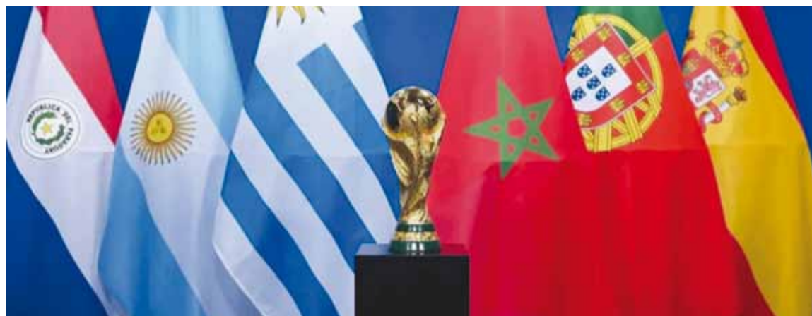
El Mundial 2030 tendrá seis países que recibirán, al menos, un encuentro

La decisión se dio a conocer en el Congreso extraordinario que encabezó el presidente Gianni Infantino en Zúrich