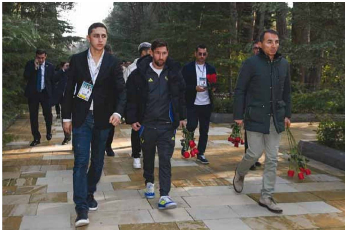
Lio Messi, en Azerbaiyán

El astro argentino Lionel Messi realizó un curioso viaje a Azerbaiyán junto al uruguayo Luis Suárez y los españoles Jordi Alba y Sergio Busquets, quienes son sus compañeros en el Inter Miami de Estados Unidos.