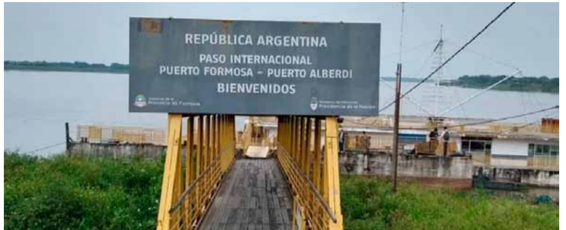
El paso fronterizo en la provincia de Formosa, por donde habrían sacado a un niño

Dio detalles de cómo se enteró de que utilizaron el nombre de su hijo para sacar del país a un menor