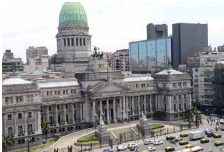
La fachada del Congreso nacional

presidencial Manuel Adorni había anunciado en su cuenta de X que el Gobierno había decidido esa alternativa e incluso con los temas que se iban a tratar fuera del período ordinario.