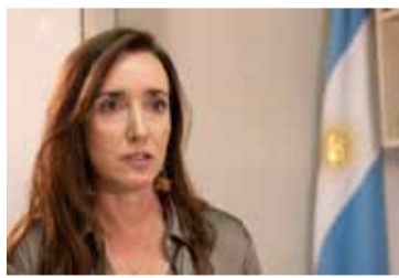
Victoria Villarruel, presidenta del Senado

Por el momento, ninguna de las iniciativas reúne los dos tercios de los presentes que exige el artículo 66 de la Constitución Nacional para remover o suspender a un legislador del ejercicio de su escaño. Kueider, por su parte, presentó un pedido de licencia, sin especificar si es con goce de su dieta ni el plazo. (DIB)