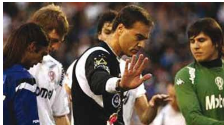
Brazenas dejó el arbitraje tras el partido

Este político es muy recordado en Azerbaiyán y, según datos oficiales, hay entre 60 museos y centros en su honor.