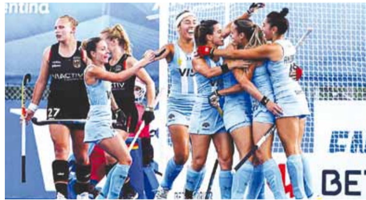
Las Leonas, siempre candidatas