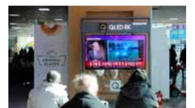
La crisis en Corea no tiene fin

A primera hora del día, la Policía llevó a cabo redadas en la Agencia Nacional de Policía, la Policía Metropolitana de Seúl y la Guardia de la Policía de la Asamblea Nacional, así como en la oficina presidencial. La Policía investiga al presidente Yoon por varios cargos, entre ellos el de insurrección, tras la declaración de ley marcial por parte de Yoon en la noche del 3 de diciembre,