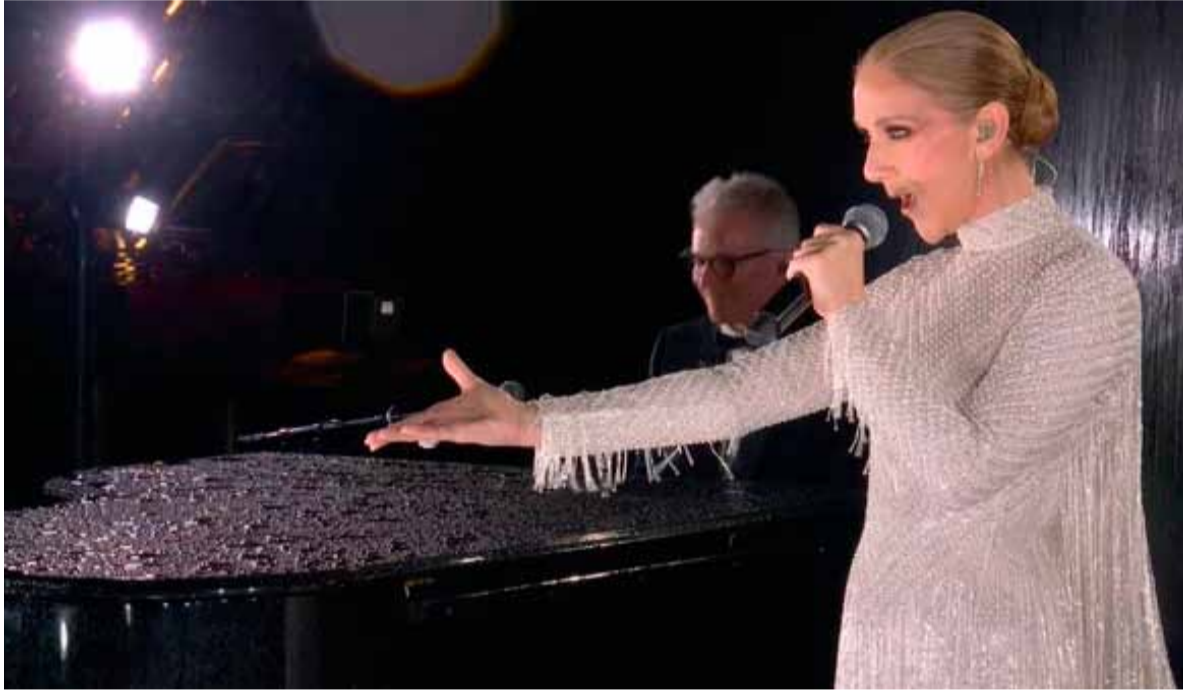
Emoción. La aparición de Celine Dion, en la Torre Eiffel

El presidente del COI, Thomas Bach dio el discurso de apertura