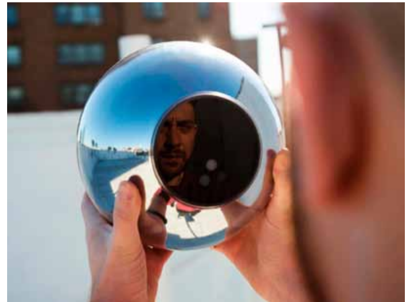
Sanción. A la empresa empresa Worldcoin Foundation

Vale destacar el necesario control que requieren este tipo de empresas que permiten y promueven la obtención de datos biométricos sensibles de menores de edad con la problemática actual de la ludopatía en adolescentes, producto de apuestas online. Justamente, hace días el gobierno de la Provincia presentó un plan integral para abordar esta temática. (DIB)