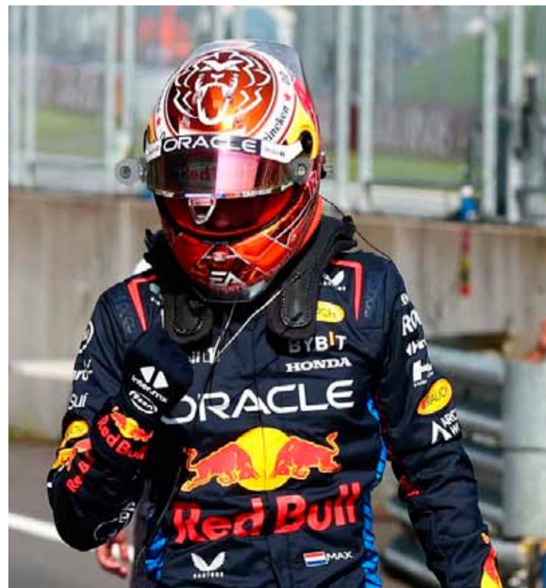
Sancionado. El actual campeón mundial

F1: los horarios y cronograma del GP de Bélgica Sábado 27 de julio 07.30 – Prácticas Libres 3 11.00 – Clasificación Domingo 28 de julio 10.00 – Carrera