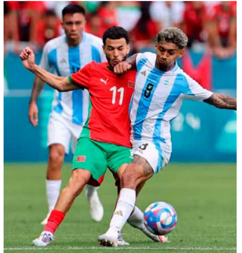
Victoria. La que necesita Argentina hoy

Por su parte, el entrenador de Irak todavía no confirmó los nombres que irán desde el arranque ante la Albiceleste.