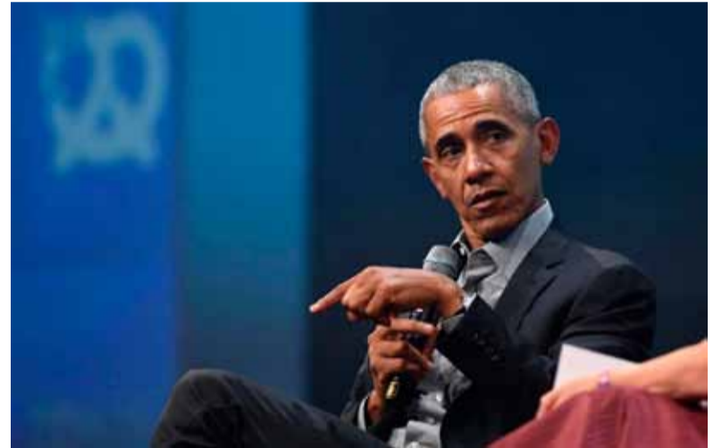
El expresidente. Apoyó a Harris

Obama, que fue presidente de EE. UU. durante ocho años tras ganar las elecciones en 2008, es el último demócrata destacado en respaldar la candidatura de Harris después de que el actual presidente, Joe Biden, informara el domingo su retirada de la carrera presidencial.///