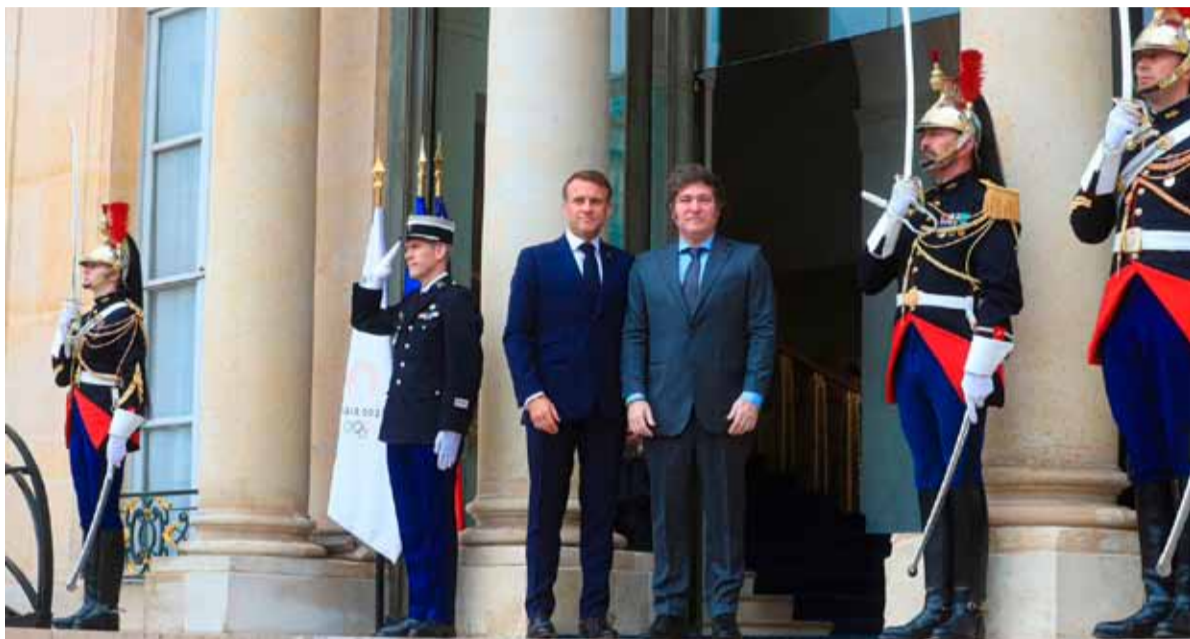
En Francia. Javier Milei y Emmanuel Macron mantuvieron una reunión

Lo dijo en una breve declaración realizada en el marco de su visita a París, donde se reunió con Macron