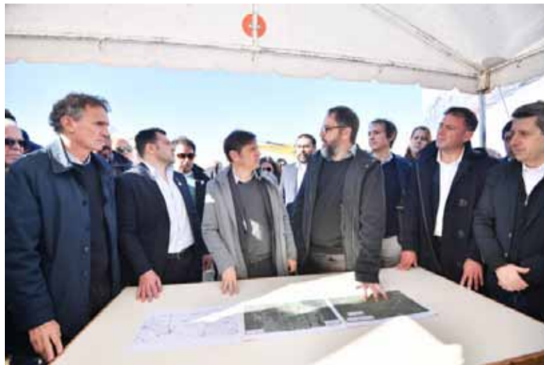
Inauguración. Kicillof y sus ministros participaron de un acto en Guaminí

El mandatario provincial también inauguró las nuevas instalaciones de la sucursal del Banco Provincia en Casbas, que hasta el momento funcionaban en un local alquilado. Estas contarán con tres cajeros automáticos, puestos de te-