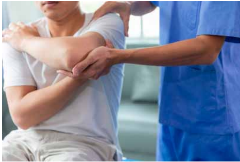
Denuncian. Que que se presentan como “Auxiliares” o “Asistentes de Kinesiología”

“La situación es compleja, ya que los principales damnificados