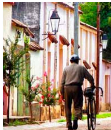
Villa Tulumba. Conocida por su bella arquitectura colonial

esquinas”, un sitio encantador que fue fuente de inspiración de muchos artistas. Continuando por la Calle Real se llega a la casa la familia Reynafé, autores intelectuales del asesinato del caudillo riojano Facundo Quiroga en 1835.///