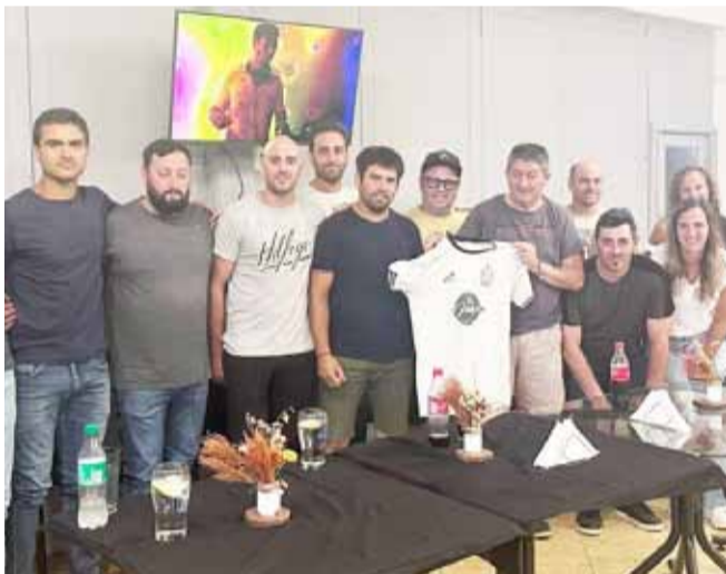
El entrenador fue presentado en enero (imagen).

La noticia se conoció esta semana, la cual indica que el entrenador dejó de estar al frente del conjunto que participa de la Liga de Tres Lomas. El bolivarense con pasado en Banfield se hizo cargo del plantel profesional a principios de 2024. Además comandó los destinos de la Reserva y de dos divisiones formativas.