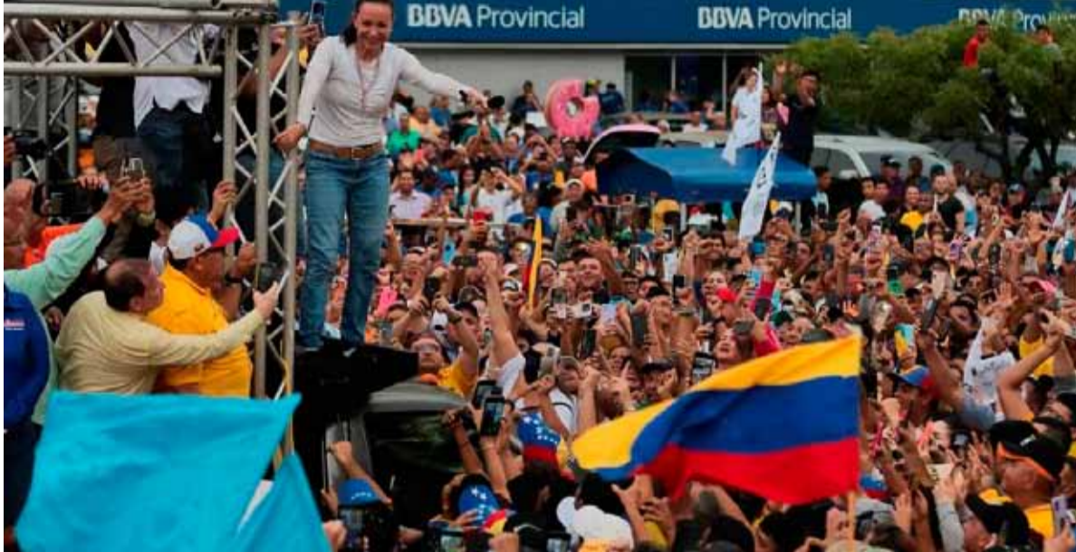
Alegría. Por el cierre de las elecciones en Venezuela

Más de 28 millones de venezolanos están habilitados para votar