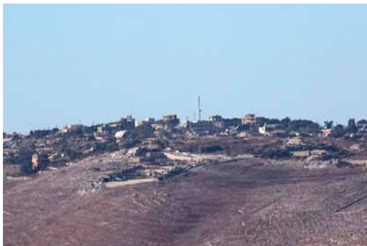
Sin freno. El área de guerra se expande en el Líbano

El grupo afirma haber atacado más de 4.200 "objetivos enemigos" tanto en Israel como en el sur del Líbano, donde hace una semana el Ejército israelí inició una serie de operaciones terrestres que Hizbulá logró contener en