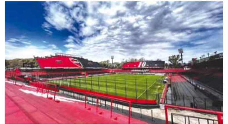
Estadio Coloso Marcelo Bielsa de Rosario