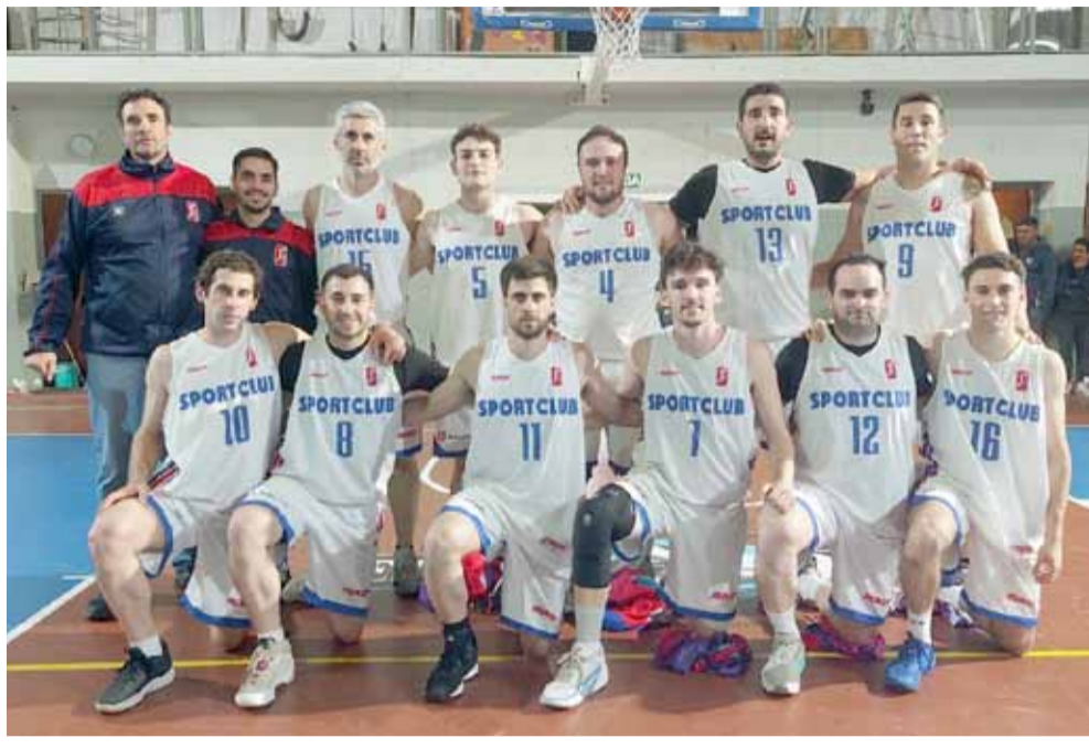
LA IMAGEN DEL FIN DE SEMANA

Jueces: Colegio de Árbitros de Olavarría.