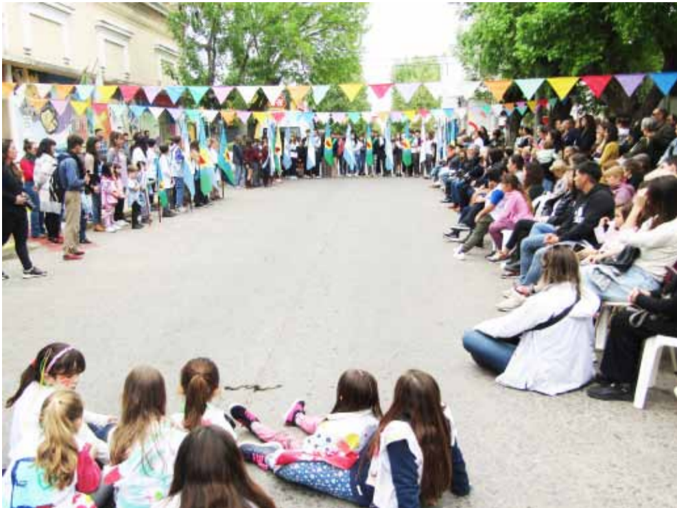
Muy buena cantidad de público concurrió a la imposición del nombre.

Campo completó su participación leyendo un poema de su autoría, escrito el día siguiente del adiós de Santos Vega, ocurrido a principios de octubre de 2020 –casi cuatro años antes de este acto, a sus 90 años-, en el que le tributa todo su agradecimiento y su amor por un tiempo compartido que seguramente lo cambió para siempre. Nadie puede quitarme estas palabras, se titula la pieza literaria, y la presentó en la Feria del Libro de este año, en una sala colmada y junto a un colectivo mapuche. Entre los mensajes alusivos que se enviaron, mencionaremos aquí el de la Mesa de trabajo autoges-