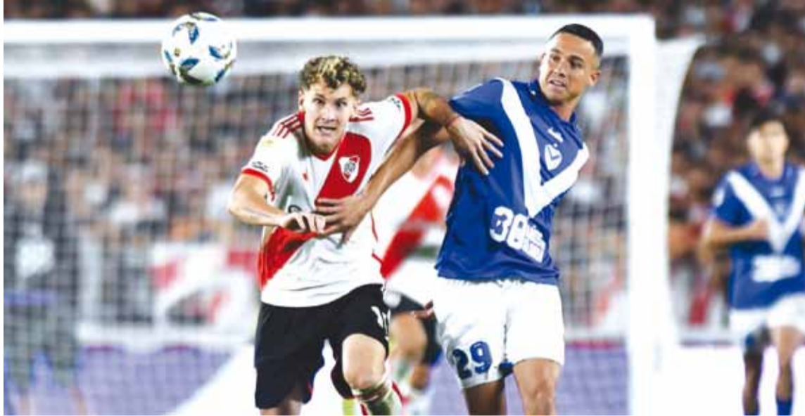
River Plate y Vélez, el partido destacado de la fecha 18

La fecha 18 tiene el encuentro entre el puntero, Vélez, y River Plate