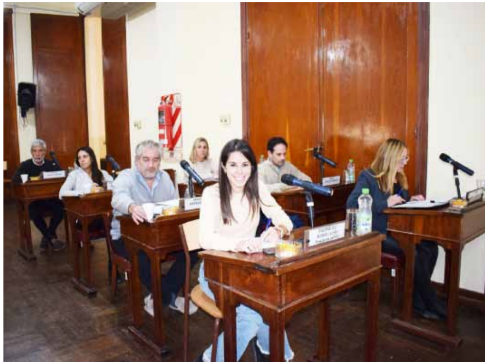
Bloque Unión por la Patria - Partido Justicialista.