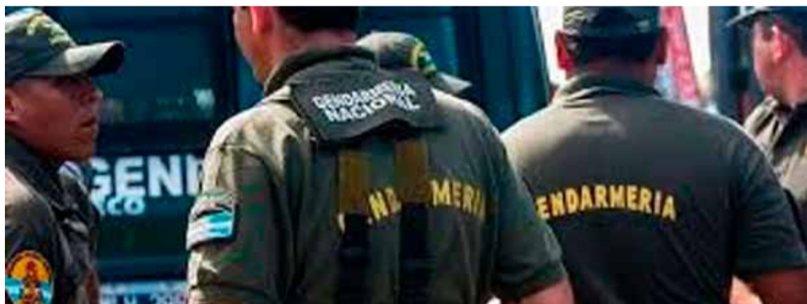
En Concordia. Gendarmería detuvo a una mujer

Una mujer fue detenida este martes en la ciudad entrerriana de Concordia como acusada de vender a su hija de 16 años, mientras que en la localidad correntina de Paso de los Libres fue arrestado el supuesto comprador, quien se encontraba junto a la menor.