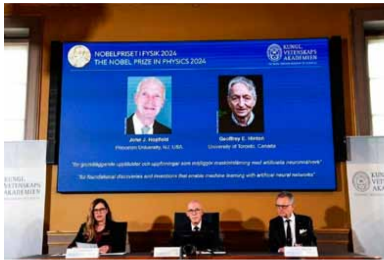
Anuncio. De los ganadores de la Real Academia de Sueca de Ciencias

Utilizaron herramientas de la física para desarrollar métodos que son la base del potente aprendizaje automático de hoy en día, explicó la academia en un