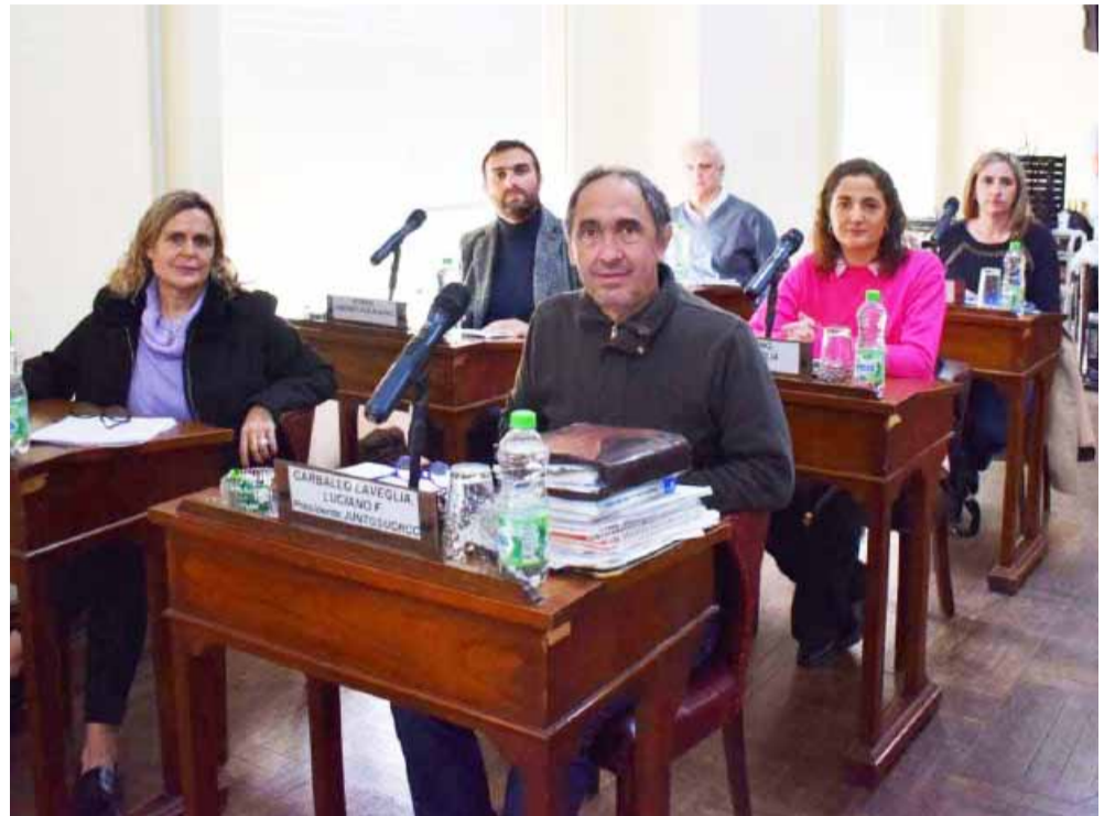
Bloque Juntos UCR-CC.

f) Expediente N° 8.873/2024-2025 (Juntos UCR-CC). Proyecto de decreto declarando de Interés Municipal el 71º campeonato nacional de vuelo a vela, a realizarse