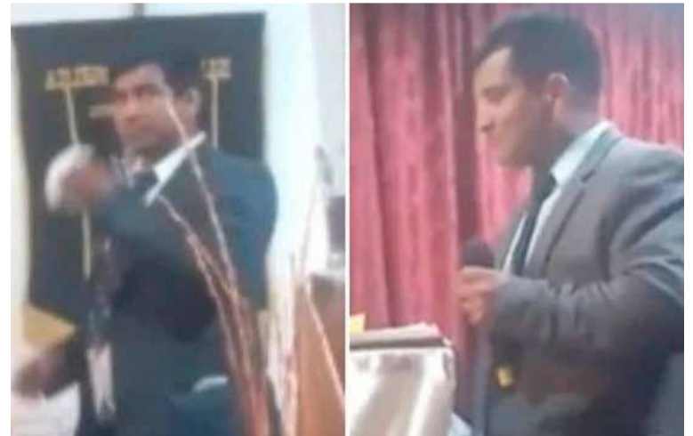
En Mar del Plata. Hay tres detenidos