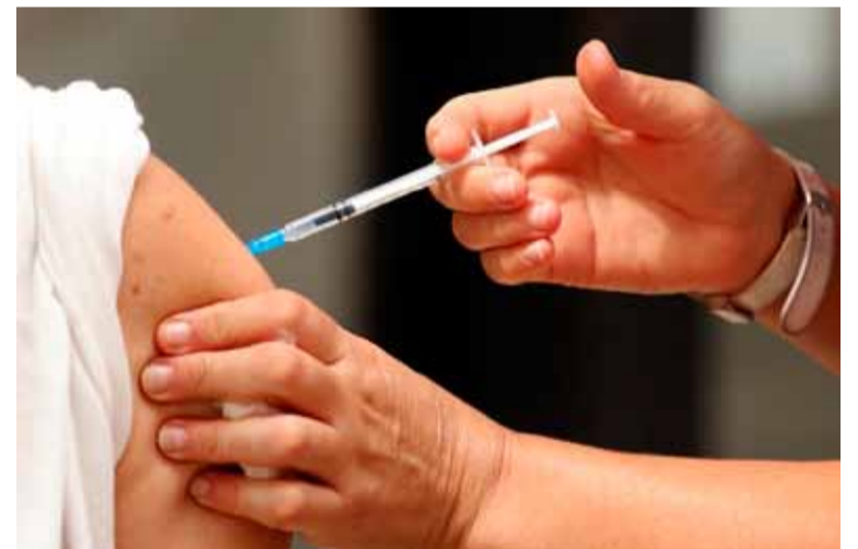
Turnos. En Provincia, desde la semana próxima

Cabe señalar que este año habrá mayor riesgo de dengue grave por la circulación de varios serotipos en simultáneo. Hasta ahora, en territorio bonaerense solo se habían reportado casos de DEN-1 y DEN-2, pero en la región ya circulan además el DEN-3 y DEN-4.