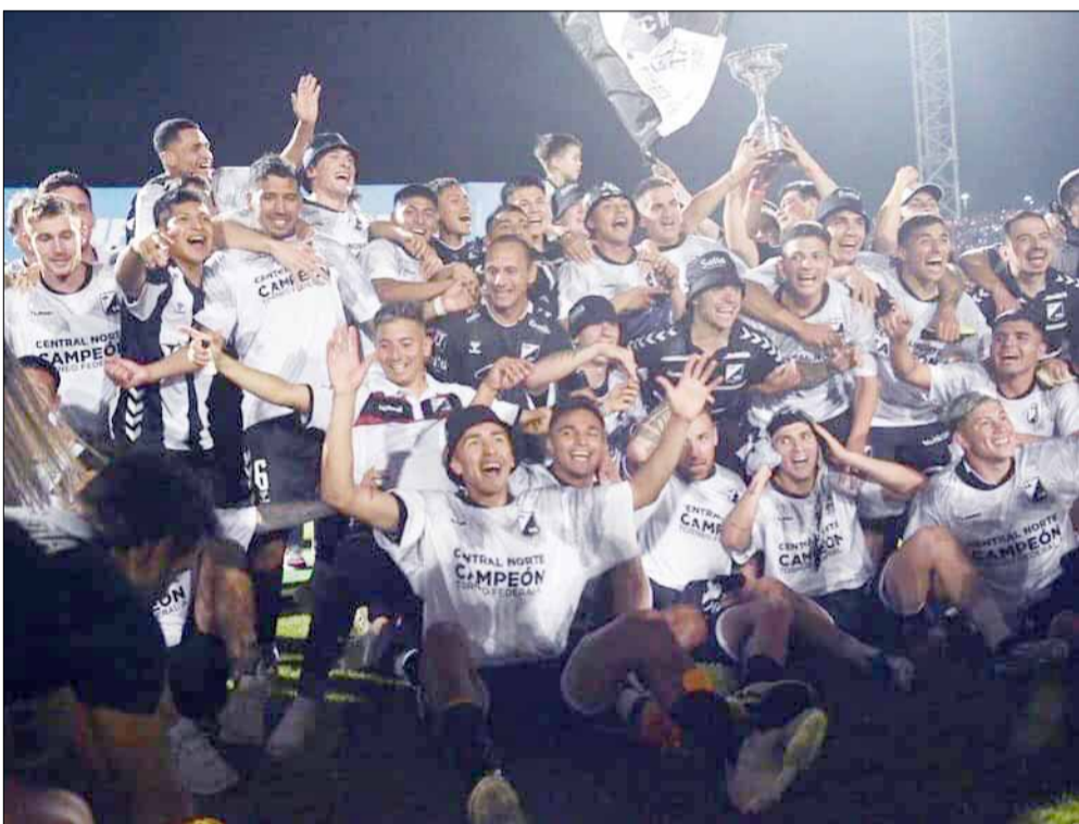
La alegría salteña tras la consagración y la obtención del pasaporte a la segunda división del fútbol argentino para el año próximo.

Esta fase se juega a "partido y revancha", con ventaja deportiva para el equipo que defina en condición de local.