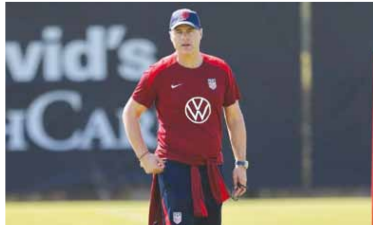
Pochettino, en su nueva etapa

Estados Unidos enfrentará a Panamá el 12 de octubre y a México el 15, encuentros cruciales para la nueva era bajo el mando de Mauricio Pochettino.