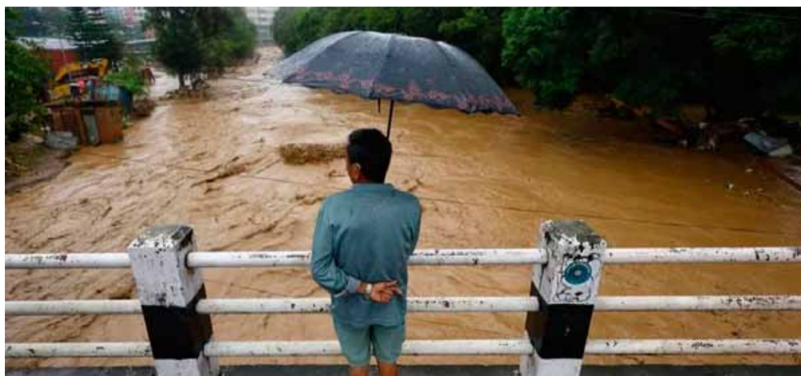
En el Amazonas. Temen por unas 200 personas atrapadas

Alrededor de 200 personas podrían haber quedado sepultadas tras un deslizamiento de tierra ocurrido en las últimas horas en el Puerto de Terra Preta, en el municipio brasileño de Manacapuru, estado de Amazonas (noroeste), informaron fuentes oficiales.