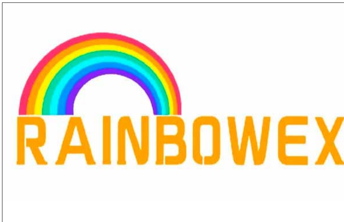
Marca. Rainbow Exchange está involucrada en el escándalo en San Pedro

La empresa Rainbow Exchange, involucrada en el escándalo de la presunta estafa piramidal en San Pedro, advirtió que suspendieron los pagos durante 14 días hábiles.