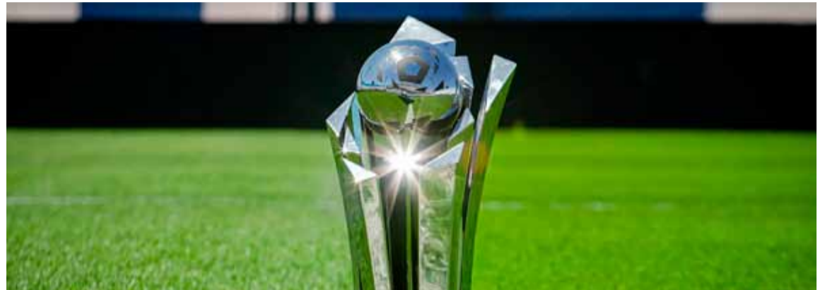
El trofeo de la Copa Argentina busca un nuevo dueño esta noche

Este miércoles, el Fortín y el Ferroviario chocan en Santa Fe