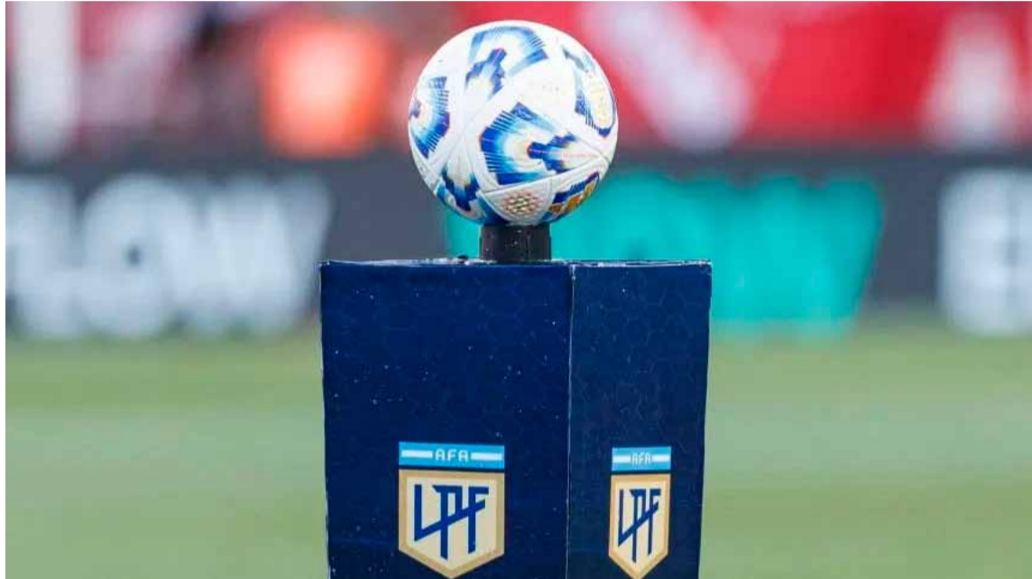
La Liga Profesional no sólo busca el campeón, sino también a los clasificados para las copas internacionales

Además de los tres que buscan el título, hay otros que quieren sumarse a los torneos internacionales en 2025