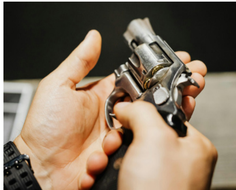
El gobierno. Flexibiliza la edad para portar armas

El Gobierno modificó la ley nacional 20.429 de armas y explosivos con el objetivo de bajar de 21 a 18 años la edad mínima para ser legítimo usuario de armas. Lo hizo a través del Decreto 1081/2024, publicado este martes en el Boletín Oficial.