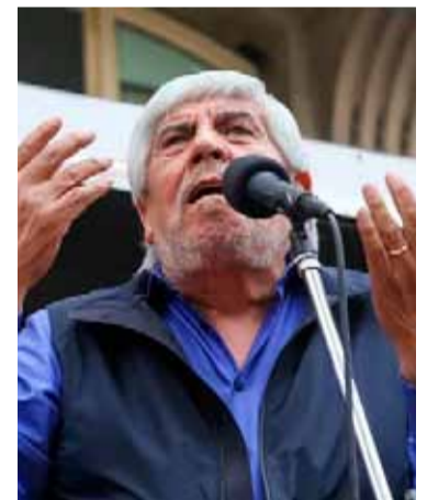
Hugo Moyano vuelve al ruedo

Pablo Moyano impulsaba un paro o gran movilización para principios de diciembre contra las políticas de la gestión libertaria,