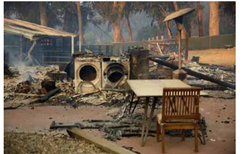
Avanza incendio en California. Decenas de evacuados.

Un incendio todavía sin controlar ha obligado a la evacuación de unas 6.000 personas y el cierre de carreteras y escuelas ante el riesgo de rápida propagación de las llamas en la ciudad de Malibú, en el oeste de California.