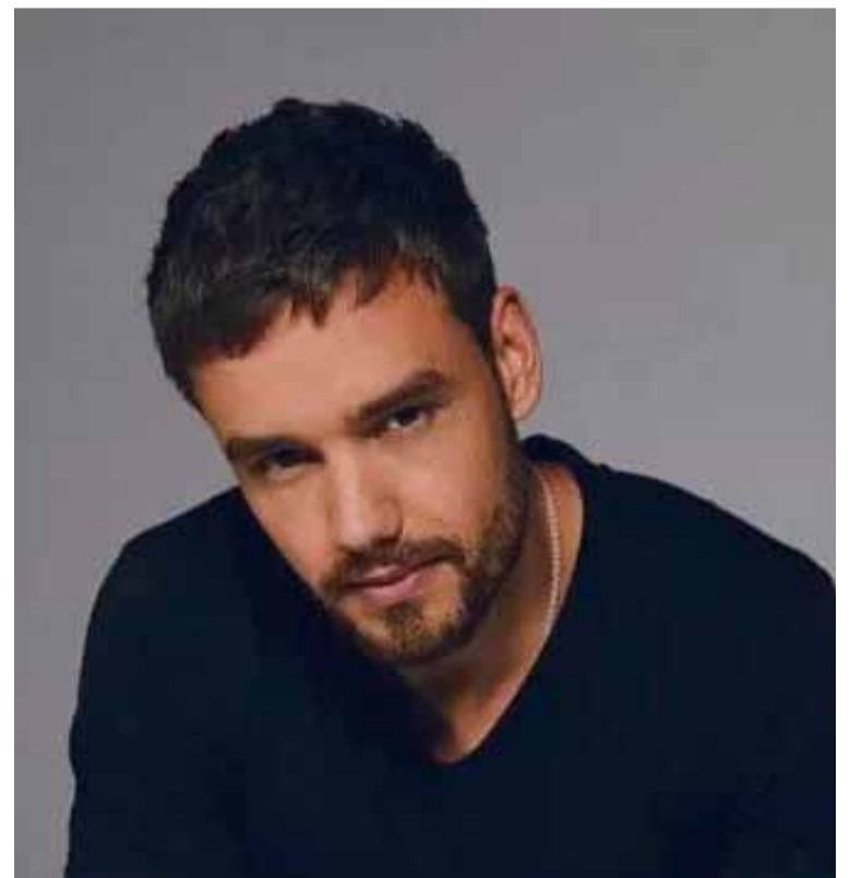
Investigaciones. Avanzan en el caso de Liam Payne

"Todo el fondo del lago tiene coladeras, que son raíces de árboles, y elodea, que son las plantas que se ven en la superficie. Esas plantas subacuáticas lo que hacen es ejercer una succión. Por eso, está absolutamente prohibido sumergirse o bañarse en este lago: si se ingresa la planta y la coladera succionan y la persona no hace pie, no puede flotar y entra en paro respiratorio", explicó.///