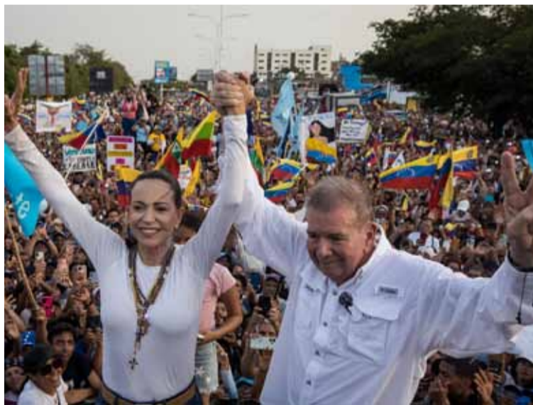
González Urrutia. Liderará la transición política en Venezuela.

mos. Maduro me acusa de terrorista y dice que soy una prófuga de la Justicia. Diosdado Cabello asegura que tiene todos los organismos de seguridad para buscarme y encontrarme", señaló, a la vez que consignó: "Venezuela no quiere saber más nada con el socialismo. Los ciudadanos militares tienen las mismas aspiraciones que nosotros. Quieren vivir con dignidad, respeto y sus