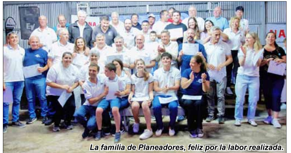
La familia de Planeadores, feliz por la labor realizada.

Gracias a que los miembros del club trabajaron mucho, y a la buena predisposición que hubo en todo el ámbito de Planeadores, la gente se sintió cómoda. No fallamos en ninguna de las áreas, por ejemplo las de sanitarios, cantina, que estuvieron