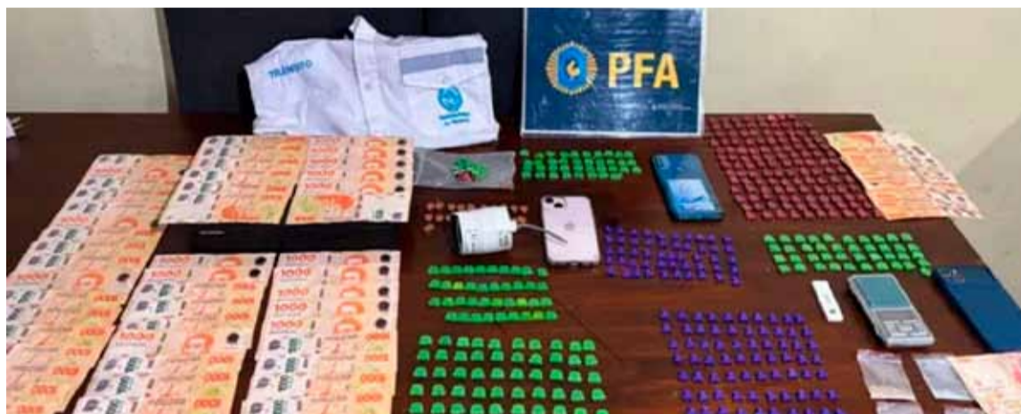
Operativo. Denuncian red de drogas vinculada a inspector vial.