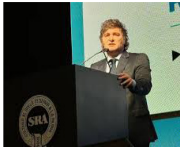
El presidente volvió a la Sociedad Rural y prometió bajar retenciones

Según mencionó, ya cumplió su promesa de desregular el mercado y sacarle trabas al sector agropecuario. Fue en el marco de la jornada de Delegados, Directores y Consejo Federal de la Sociedad Rural.