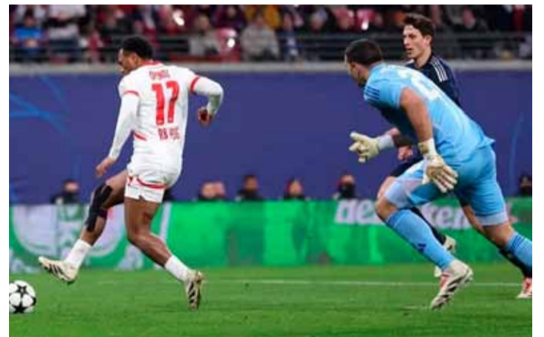
Martínez no pudo evitar el gol

El Dibu Emiliano Martínez fue gran protagonista este martes del encuentro entre Aston Villa y RB Leipzig en Alemania, que terminó 3-2 para la visita por la sexta fecha de la Champions League.