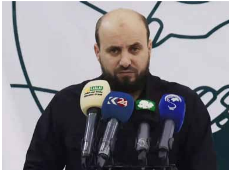
Siria. Tendrá un gobierno transitorio liderado por Al-Bashir.

El Ejército israelí anunció este martes que su marina llevó a cabo una operación a gran escala