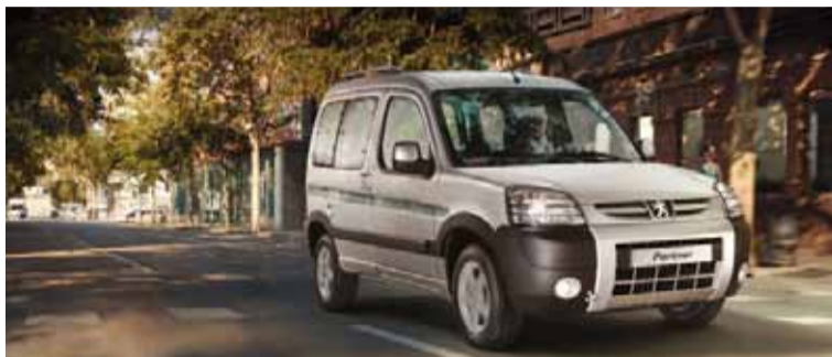
Desregulación. Cambian las normas para transporte de pasajeros.

El trámite, que estará disponible a partir este 11 de diciembre, es obligatorio para la prestación de servicios de transporte automotor de pasajeros y tendrá carácter de Declaración Jurada (DDJJ). El