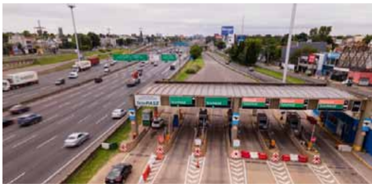
Nuevos incrementos. Impactan a los usuarios de peajes

El incremento de 3,27% se aplicará en los tramos de rutas nacionales controlados por la empresa Corredores Viales S.A ubicados en provincia de Bue-