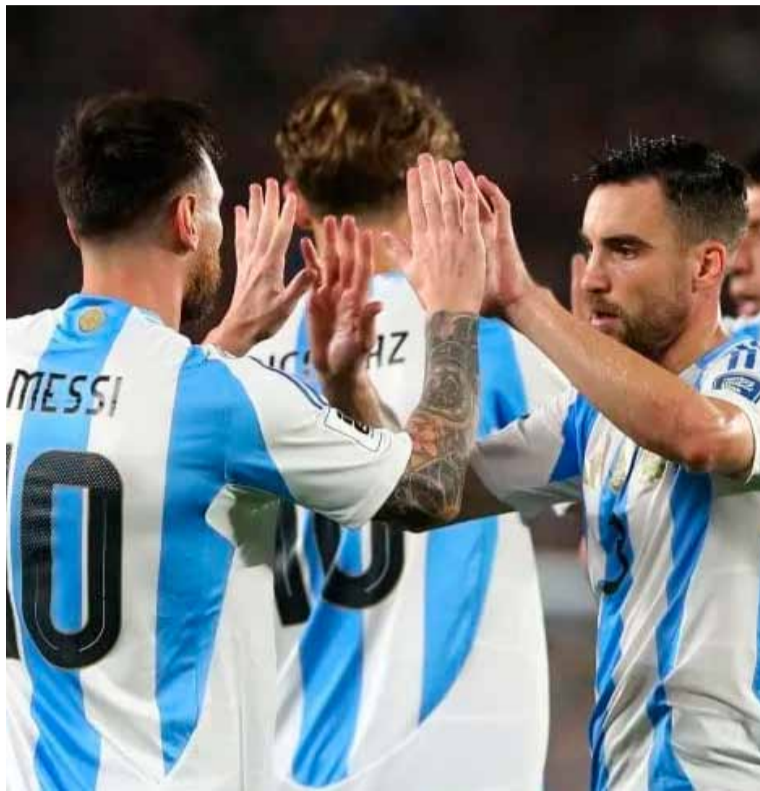
Tagliafico y Messi, en la Selección

La delicada situación financiera de Olympique de Lyon puede provocar un éxodo masivo de futbolistas. Y allí aparece el nombre de Nicolás Tagliafico, quien en un distendido stream se refirió al futuro de su carrera y hasta fantaseó con la posibilidad de jugar con Lionel Messi, no solo en la Selección Argentina, sino también en Inter Miami.