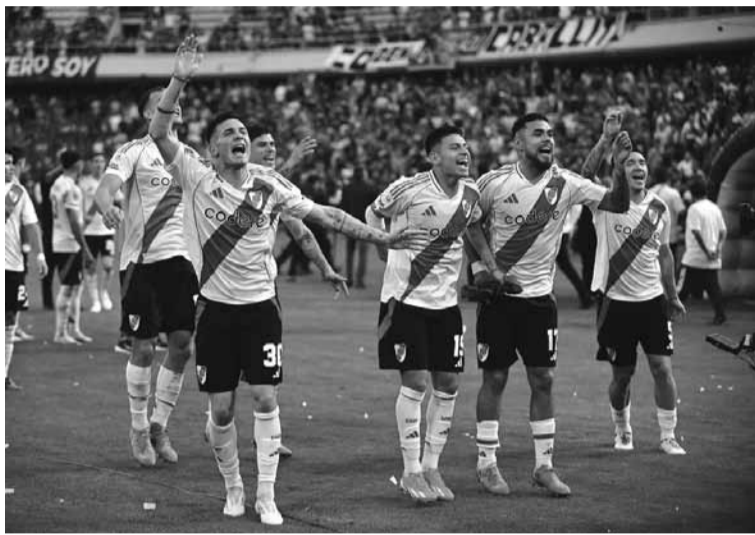
River viene de empatar en Chile y vencer a Boca en La Bombonera