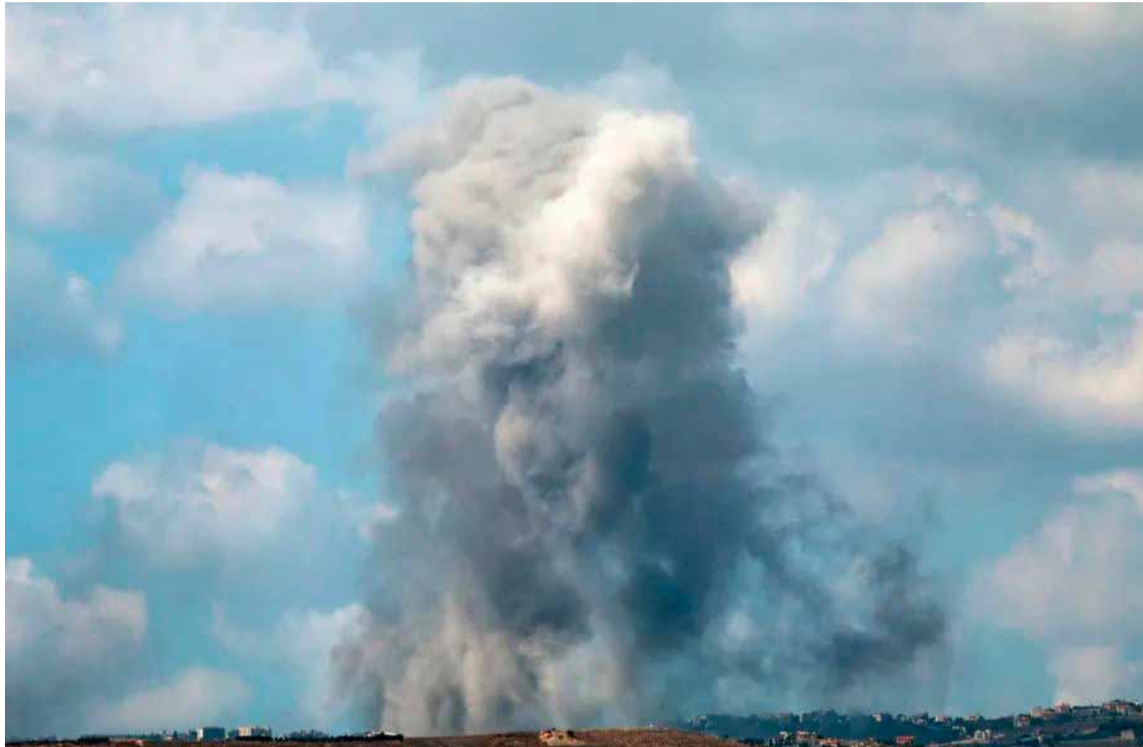
Fuego sobre el Líbano. En la región temen una guerra total

La cifra de heridos se elevó a 1.645 por bombardeos israelíes