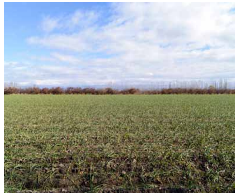
En emergencia. Por la sequía en la provincia

Ambos casos son por sequía y para los mismos cincuenta distritos: Bahía Blanca, Puán, Patagones, Junín, Bolívar, Tornquist, Carlos Casares, General Alvear, Magdalena, Nueve de Julio, General Viamonte, Rauch, Villarino, General Arenales, Tordillo, Saladillo, Suipacha, Carlos Tejedor, Trenque Lauquen, Alberti, General Villegas, Pila, San Andrés de Giles, General Belgrano, Adolfo Alsina, Coronel Rosales, Pergamino, Lobos, Bragado, Rivadavia, Chascomús, Saavedra, Lincoln, Azul, Chacabuco, Adolfo Gonzales Chaves, Chivilcoy, General Las Heras, San Antonio de Arco, Navarro, Monte, General Lavalle, Dolores, Tres Arroyos, Luján, Maipú, Veinticinco de Mayo, Rojas, Guaminí, Ramallo y General Madariaga. (DIB)