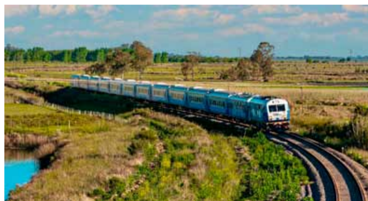
El tren. Un transporte económico para el turismo

El tren Buenos Aires-Mar del Plata es uno de los famosos a nivel nacional: parte desde Plaza