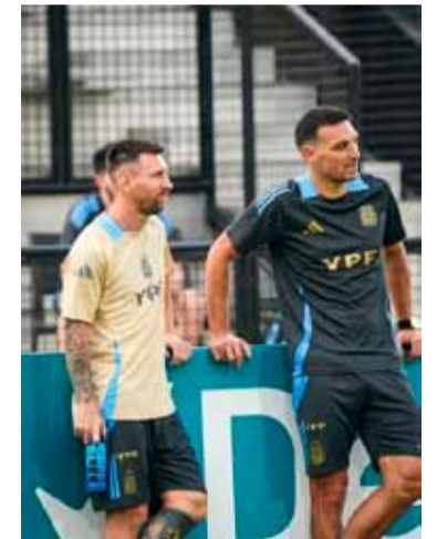
Messi volvería a la selección tras la lesión

La Selección Argentina, que viene de caer por 2-1 con Colombia como visitante, chocará con Venezuela, en el Estadio Monumental de Maturín, el jueves 10 de octubre, por la fecha 9 de las Eliminatorias. Luego, recibirá a Bolivia, el martes 15, en el Monumental de River.