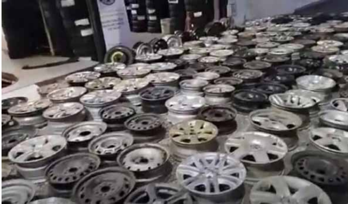
Procedimiento. En los barrios de Villa Pueyrredón y Villa Luro.

En operativos policiales cayeron falsificadores de autopartes