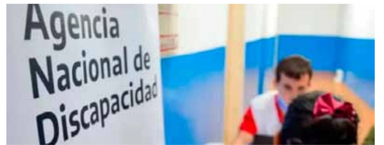
Nueva resolución del gobierno

"En consecuencia, resulta necesario restablecer los requisitos de encontrarse incapacitado en forma total y permanente y de no poseer un vínculo laboral formal ni estar inscripto en el Régimen General y/o Simplificado vigente para poder acceder a la correspondiente pensión", se añadió en el decreto. (DIB)