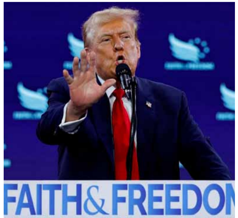
El objetivo. El candidato Donald Trump

Días atrás, el hombre fue acusado de los delitos vinculados con armas de fuego tras presuntamente huir del campo de golf Trump International. A medida que avance la investigación, podrían presentarse cargos más graves en el caso, indicó la cadena internacional CNN.