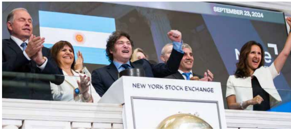
El presidente realizó el tradicional toque de campana, para dar inicio a la ronda de negociaciones

El Presidente habló ante hombres y mujeres de negocios en el New York Exchange