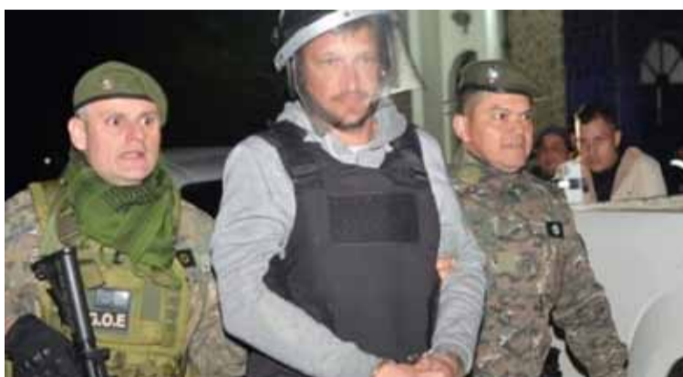
Pericias. El juzgado de Instrucción N° 4 de Apóstoles abrirá las netbooks y la CPU

Esta sospecha comenzó cuando se descubrió una conversación que la mujer y el acusado mantuvieron previo a su detención donde ella le advertía que borre