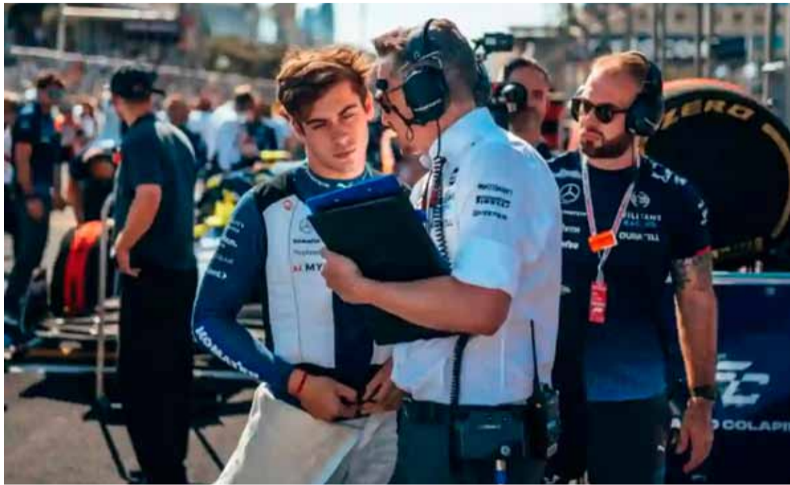
El argentino Colapinto aún no sabe qué sucederá el año próximo

El argentino podría tener que esperar hasta 2026 para continuar su carrera en la máxima categoría del automovilismo mundial