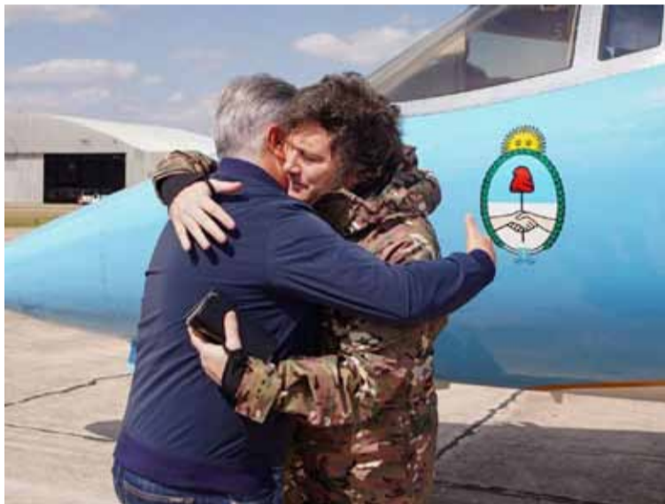
El presidente viajó a Córdoba y sobrevoló el área afectada por los incendios junto al gobernador Llaryora

Luciendo ropa de fajina, Milei supervisó con el mandatario cordobés y sus funcionarios las tareas de asistencia y rescate por los incendios en las Sierras. Posteriormente sobrevolaron los incendios, que llevan arrasadas más de 16 mil hectáreas.