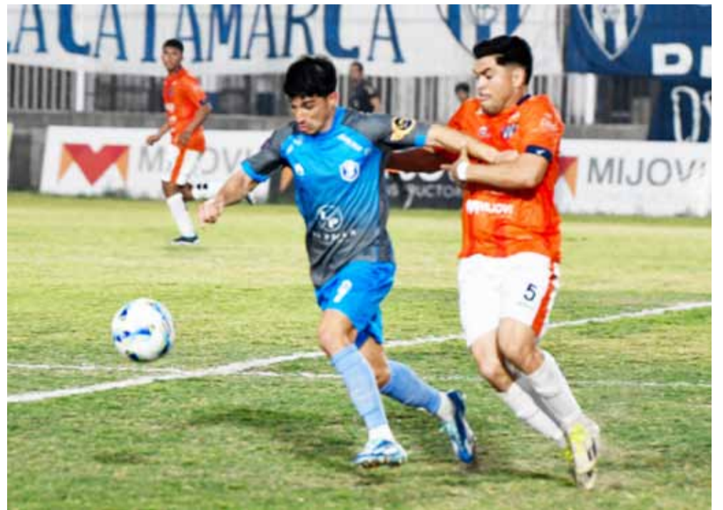
Se viene un lindo partido, un enorme desafío para Ciudad, que debe levantar el 0-1 sufrido en Santiago para ser finalista del torneo.

ción, hay una interesante demanda. Se venderían en forma anticipada, para que el domingo se vendan solamente las entradas generales. Empate en la otra llave Santamarina de Tandil y Central Norte, de Salta, igualaron sin goles en el partido de ida de esta misma instancia semifinal, jugado el domingo al mediodía en la ciudad serrana bonaerense. La serie se traslada ahora al norte del país, para definir el otro finalista.