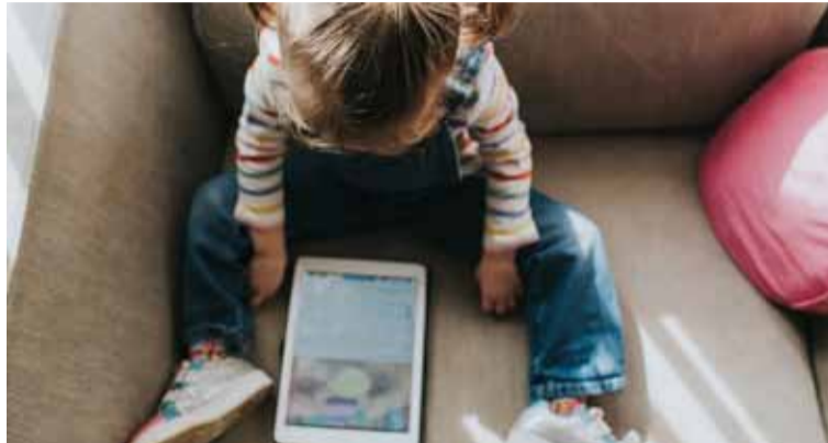
Peligros. De la exposición a las pantallas de los niños

La sobreexposición a las pantallas es una problemática creciente, compleja, que en las últimas dos décadas se instaló en la vida cotidiana de millones de personas en todo el mundo, generando consecuencias graves en la salud, en todas las edades y sectores