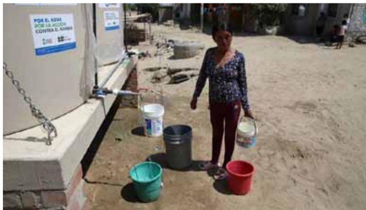
Objetivo. Según la FAO se está muy lejos del “hambre cero”

Aún así, “América Latina y el Caribe son las únicas regiones que han conseguido un progreso significativo en la lucha contra el hambre desde 2021”, dijo