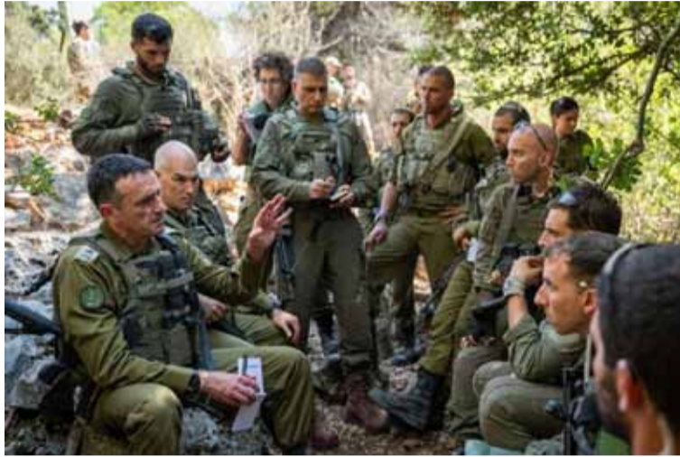
Charla. El comandante Herzl Halevi (izquierda) junto a soldados israelíes

“Tenemos que cambiar la situación de seguridad. Tenemos que estar muy bien preparados para entrar en una maniobra”, señaló el comandante de las tropas del norte de Israel, que había participado en una reunión militar sobre un simulacro de operación