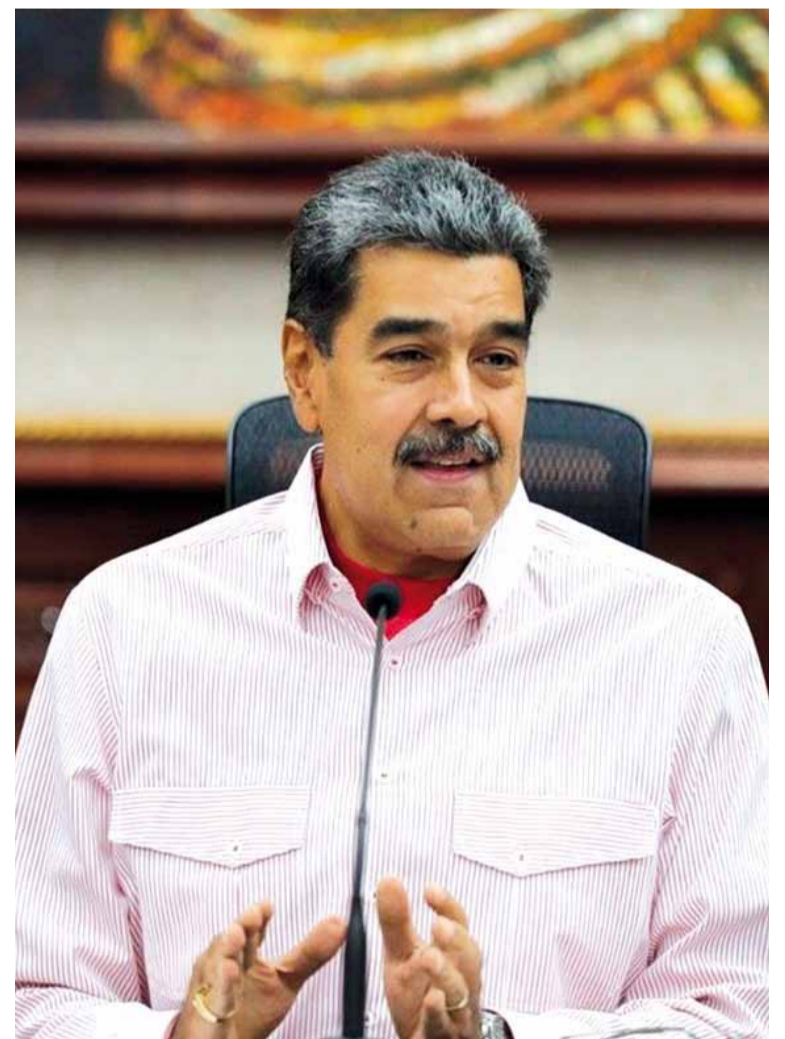
En la mira. Nicolás Maduro

Según la organización, la cuota del petróleo y el gas en la matriz energética en 2050 superará el 50 por ciento, y el petróleo representará el 29,3 por ciento, la cuota más alta de la historia.///