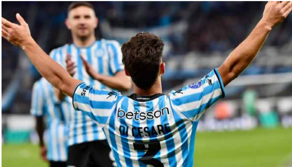
Racing enfrenta a Athletico Paranaense por los cuartos de final de la Copa Sudamericana