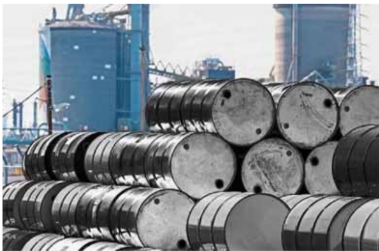
Demanda. El petróleo seguirá dominando el mercado energético

“El lanzamiento de nuestras Perspectivas aquí es una señal muy clara de la importancia de Brasil