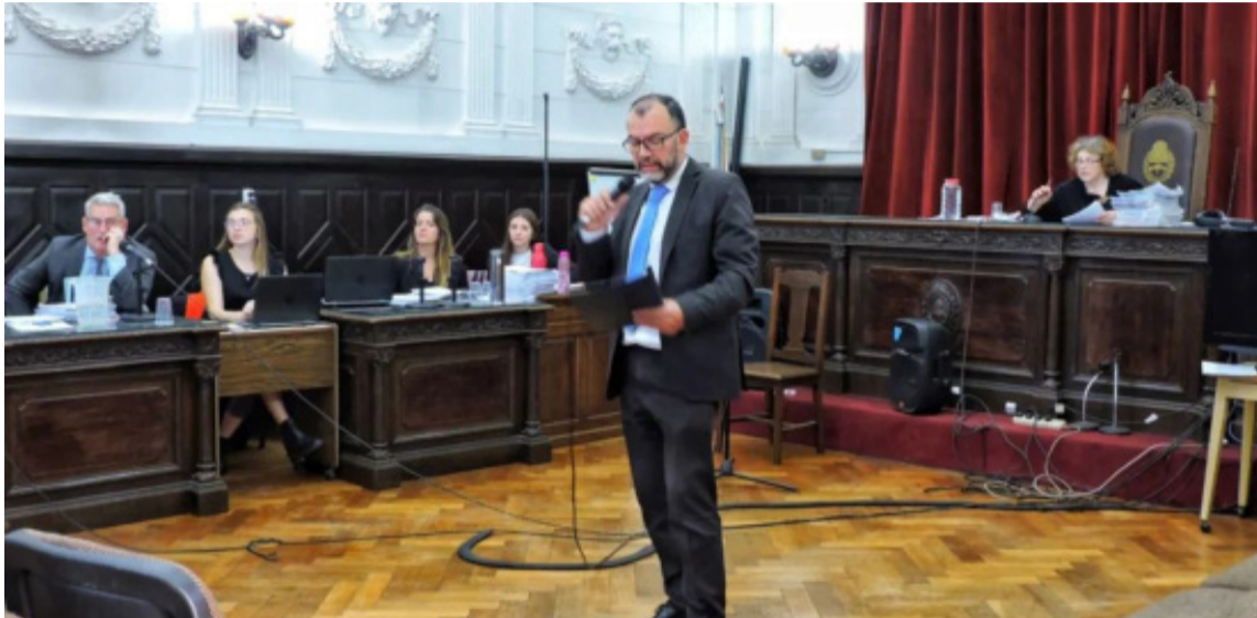
Hechos aberrantes. Debió analizar el jurado a cargo de la causa

Los imputados son el padre y padrino por abusar de dos niñas en Punta Alta