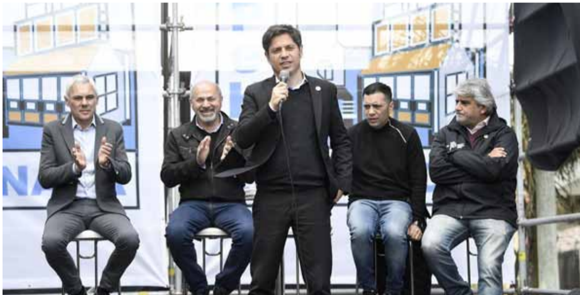
El gobernador Kicillof encabezó un acto en Berisso

Dejó una declaración que puede leerse como una respuesta a "Wado" de Pedro