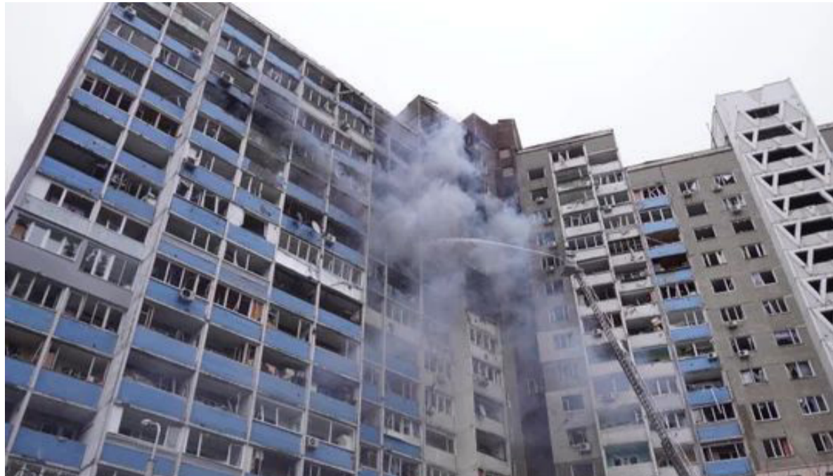
Graves daños. Provocaron drones y misiles en instalaciones ucranianas

Serios daños a la infraestructura de energía de parte del país