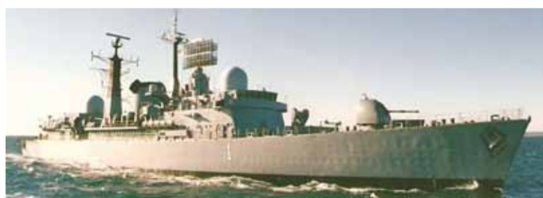
ARA Hercules. El destructor funcionaba como buque de transporte rápido

El ARA “Hércules”, destructor que participó de la guerra de Malvinas y que en los últimos años funcionó como buque de transporte rápido, quedó oficialmente fuera de servicio tras 48 años. El miércoles se llevó a cabo la última ceremonia de arriado de su pabellón nacional, el retiro de su bandera de guerra y el pase a su condición de buque radiado. Según recuerda La Nueva, el “Hércules”, construido en Inglaterra junto con el destructor “Santísima Trinidad” y de la misma clase que el buque británico HMS “Sheffield”, hundido por la Aviación Naval argentina en Malvinas, enarbó su pabellón nacional por primera vez el 10 de mayo de 1976 y ostenta la condecoración “Operaciones en Combate” por su papel en la guerra. “Es un día de sentimientos encontrados: nos invade un torbellino de profunda nostalgia y de resignada tristeza que debemos encarar con la debida