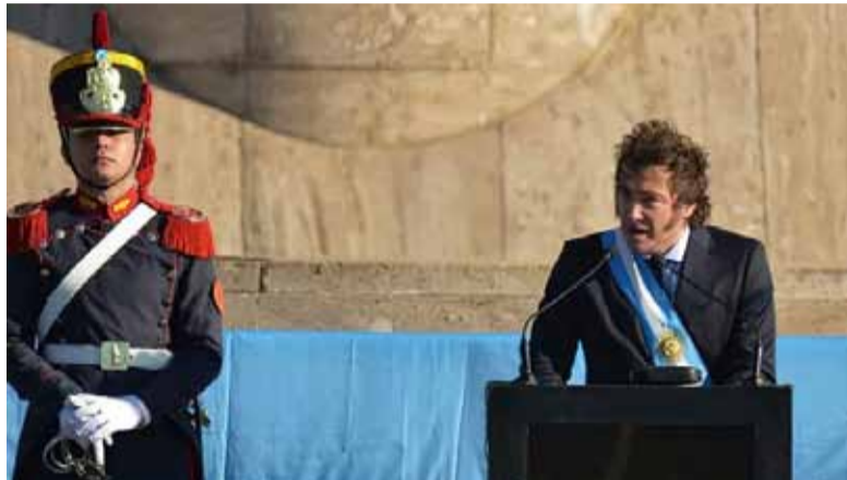
En Rosario. El presidente Milei encabezó el acto por el Día de la Bandera

En un enérgico discurso como cierre del acto oficial por el Día de la Bandera, el mandatario volvió a hacer la convocatoria para la firma del Pacto de Mayo, que originalmente era para el 25 de Mayo, pero que se frustró ante la demora de la aprobación de la Ley Bases y del pacto fiscal. Ahora llamó la atención la invitación a los expresidentes, que en caso de aceptar reuniría en Tucumán a personalidades tan alejadas en