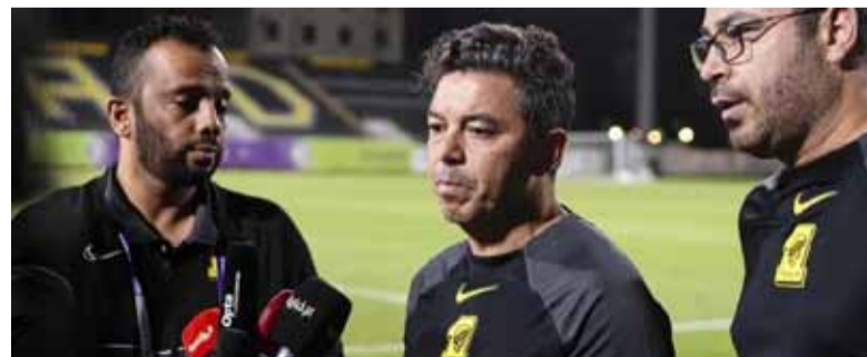
Rescisión. Marcelo Gallardo dejará el club

Partidos: 30 Victorias: 14 Empates: 3 Derrotas: 13