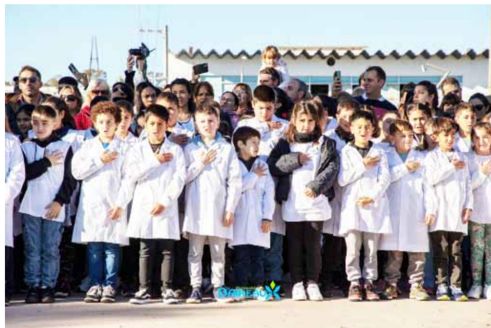
Huen, realizaron la danza llamada "La Soberana".

TORRES INMOBILIARIA Col. 954 T°IV F° 145 Lavalle 73 – Bolívar Te: 426398 / 15625905/15469900