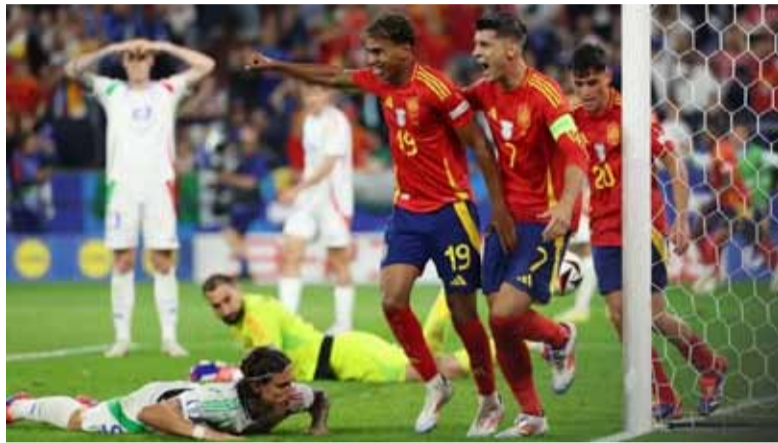
Festejo. Los jugadores españoles celebran el gol con el que terminaron ganando

en absoluto el trámite de partido: el equipo de Luis De La Fuente siguió dominando ante un timorato Italia, que ni con los cambios pudo emparejar el trámite. Donnarumma se lo volvió a tatar a Morata, Lamine Yamal casi culmina una gran jugada colectiva con un remate que se fue al lado del ángulo y Nico Williams reventó el travesaño con un remate desde el borde de área, en algunas de las situaciones claras que tuvieron los españoles para ampliar la ventaja y empezar a cerrar el partido.