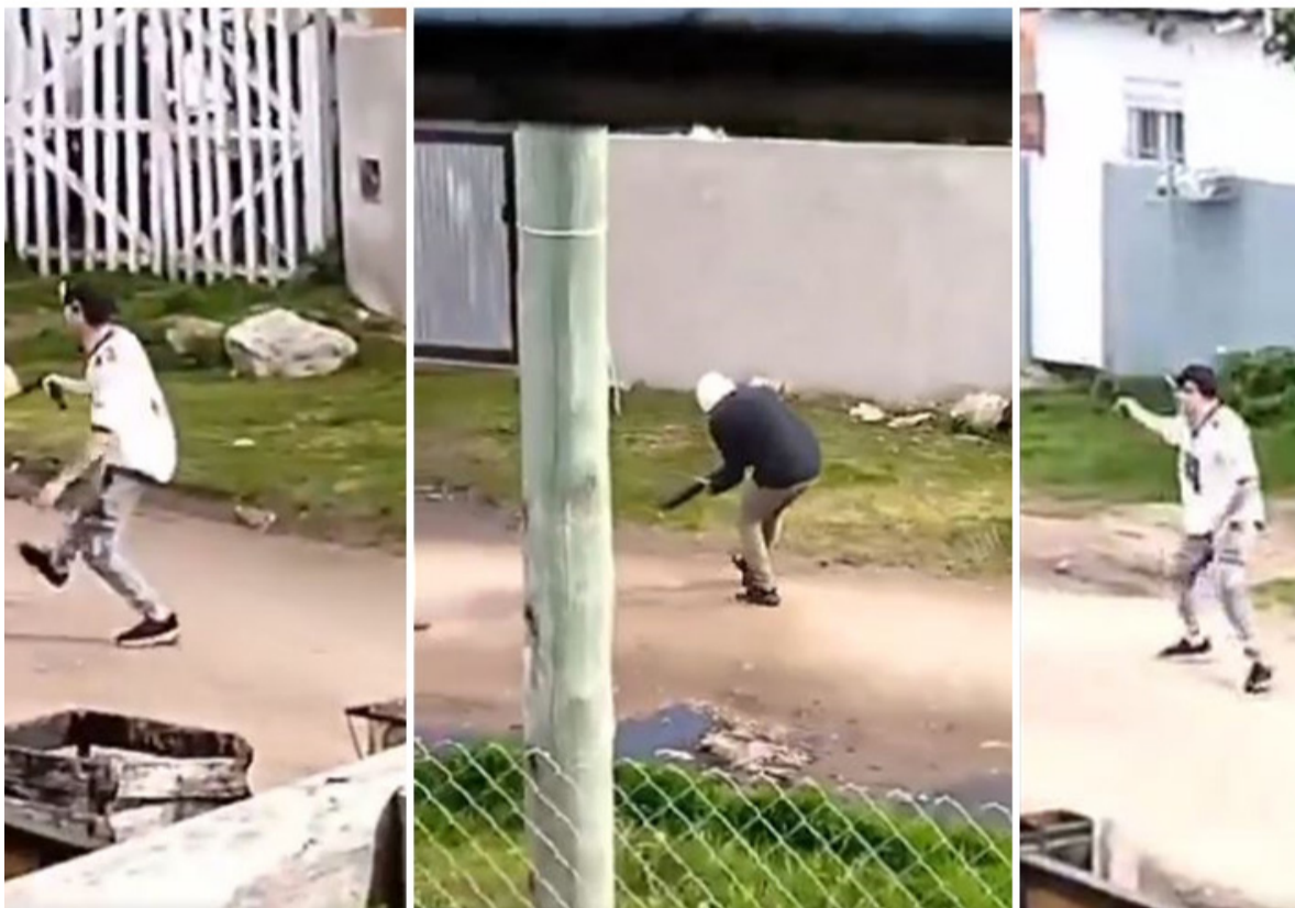
A los tiros. En el enfrentamiento se efectuaron al menos 20 disparos

Imágenes del tiroteo captadas por un vecino desde la ventana de su casa, en la zona de Parque Independencia de mar del Plata. (Captura de video)