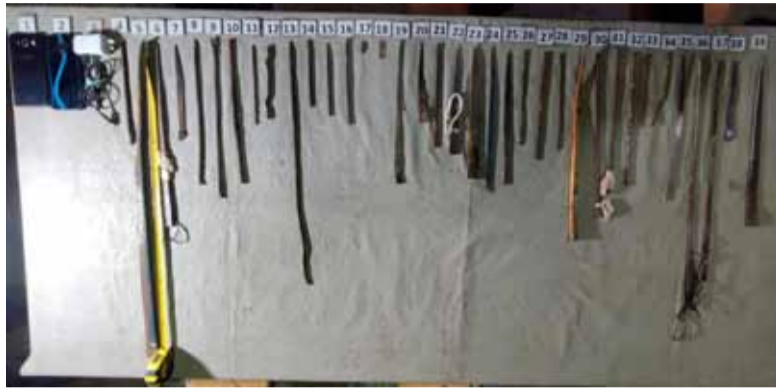
Secuestro. De gran cantidad de elementos en dos cárceles federales

Antidrogas N° 2 de la ciudad de Resistencia.