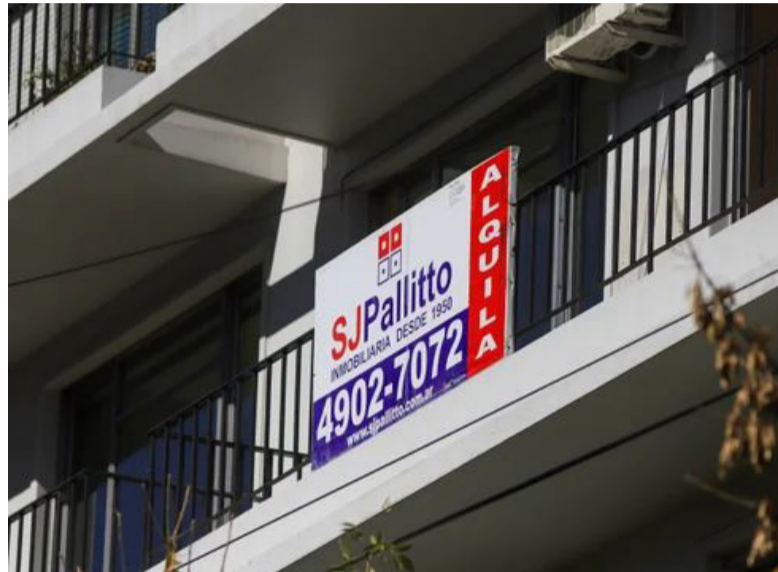
Dejar de alquilar. El sueño de muchos con los movimientos del mercado inmobiliario

Los préstamos permitirán financiar hasta el 75% del valor del inmueble a adquirir, con un plazo de devolución de hasta 20 años y serán en pesos ajustables por UVA (Unidad de Valor Adquisitivo), más una tasa fija nominal anual del