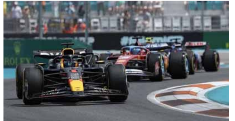
En España. Se muda el campeonato de Fórmula 1

La Fórmula 1 vuelve a Europa para la décima fecha de la temporada, más precisamente con el GP de España para albergar la jornada del 21 al 23 de junio en el circuito de Barcelona-Cataluña.