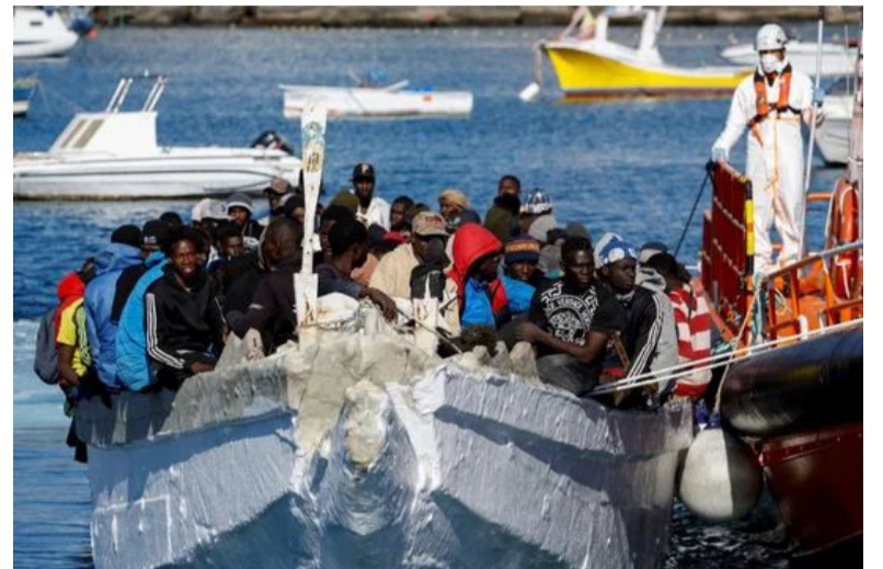
Odisea. El desesperado intento de llegar a Europa sigue dejando muertos

Un crucero de lujo rescató a decenas de personas migrantes que intentaban llegar a las Islas Canarias españolas en un barco pesquero que se había quedado varado en medio de un mar embravecido, y en el que murieron cinco personas, según informaron el jueves las autoridades españolas y el operador del crucero.