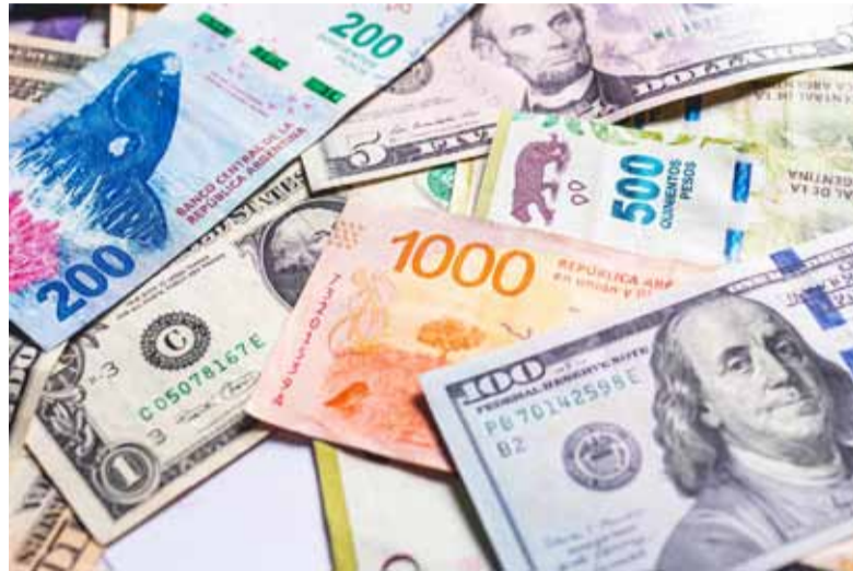
Con pesos. Por el momento, el dólar no será moneda de curso legal, según el FMI

Así, lo delimitó a una competencia de monedas con límites particulares, algunos que entran en contradicción con postulados del Poder Ejecutivo —principalmente del propio presidente— como la eliminación del Banco Central o la posibilidad del pago de impuestos en dólares. Es una idea que hace un mes Milei planteó durante