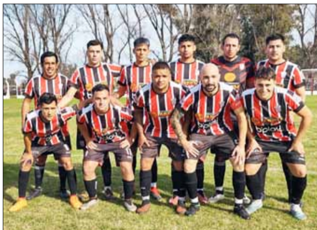
Atlético Urdampilleta (arriba) y Defensores de Guglieri se midieron en el "Néstor Reyes".