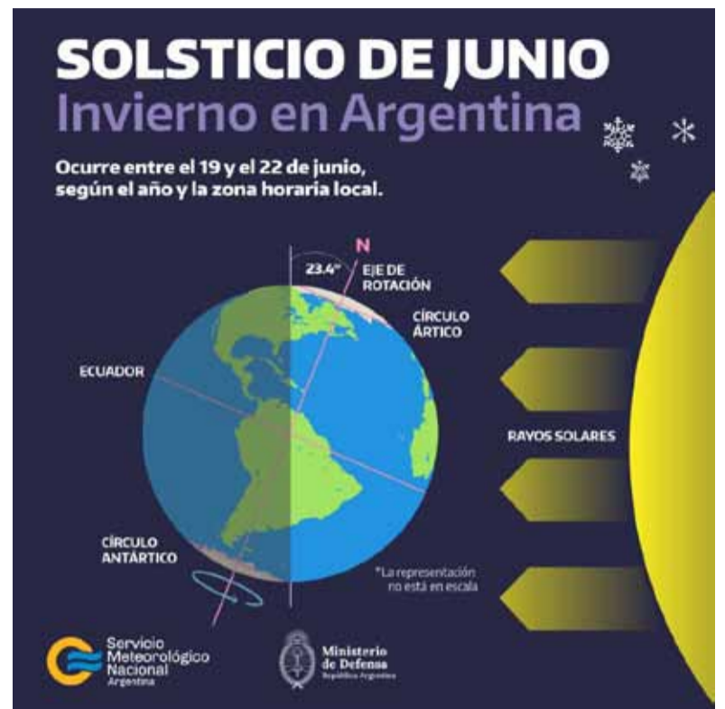
Lo que ocurrió. Infografía que muestra el solsticio de invierno

Este jueves, a las 17.51 hora argentina, comenzó oficialmente el invierno al producirse el solsticio que inaugura la estación más fría en el hemisferio sur. Además, fue el día en la que se produjo la menor cantidad de horas de luz, ya que el Sol sale y se oculta más al norte, por lo que suele decirse que es el día “más corto” del almanaque. En tanto, de acuerdo a la información difundida por el Servicio Meteorológico Nacional (SMN), que ocurra el solsticio no significa que se registren las temperaturas más bajas. Ese fenómeno se da entre 3 y 4 semanas después, ya que el hemisferio sur se sigue enfriando porque pierde más calor que el que gana con la energía solar.