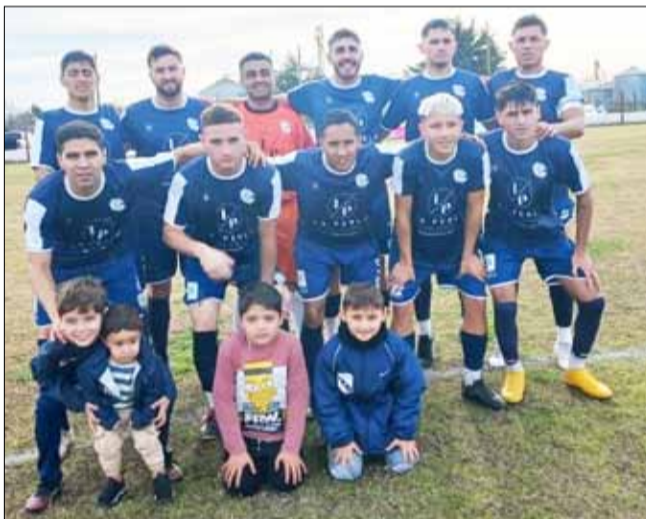
Empleados de Comercio (arriba) e Independiente, protagonistas de una nueva edición del clásico.

RALLY - CAMPEONATO BONAERENSE DEL SUDOESTE